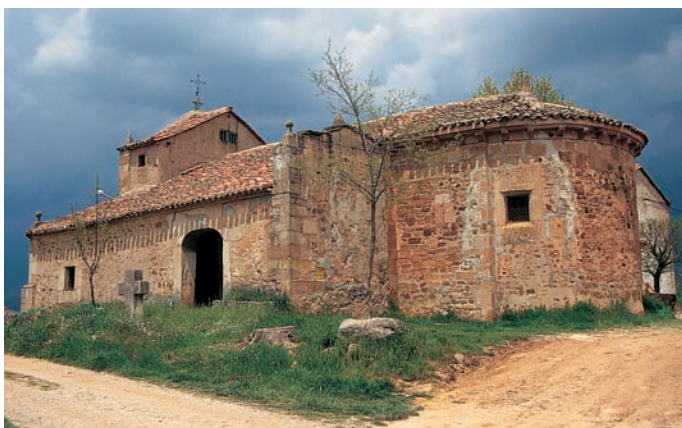
Exterior desde el lado sureste