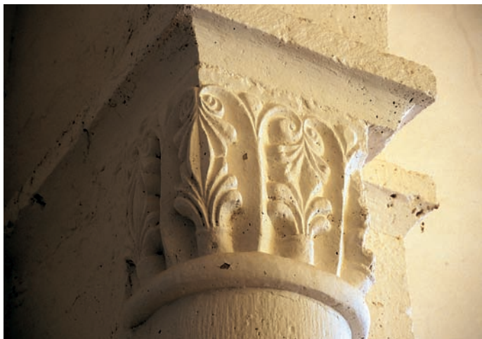
Capitel del arco triunfal

torno a los años finales del siglo XII y ponerla en relación con alguno de los talleres que trabajaron en esos momentos en otras iglesias del entorno de Calatañazor, con derivaciones, incluso, hacia tierras más septentrionales de la misma provincia.