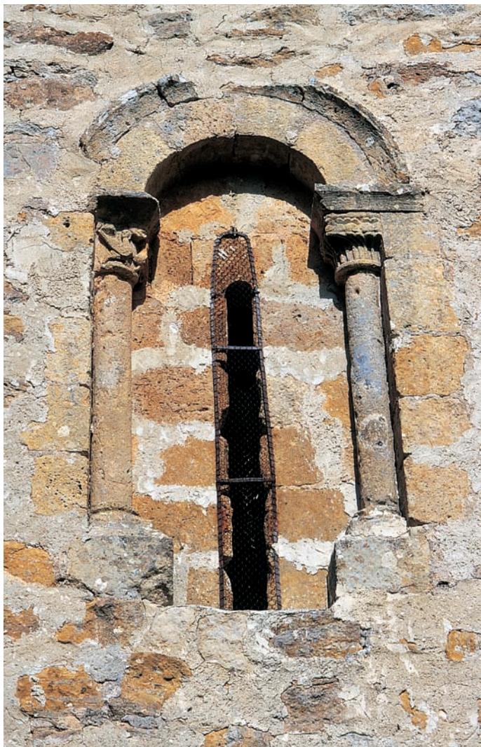
Ventana del muro occidental