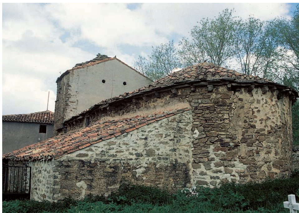
Exterior de la iglesia

Tardía, y probablemente posmedieval, nos parece la portada abierta en el muro sur de la nave. Se compone de arco de medio punto con un baquetón aplastado en la arista,