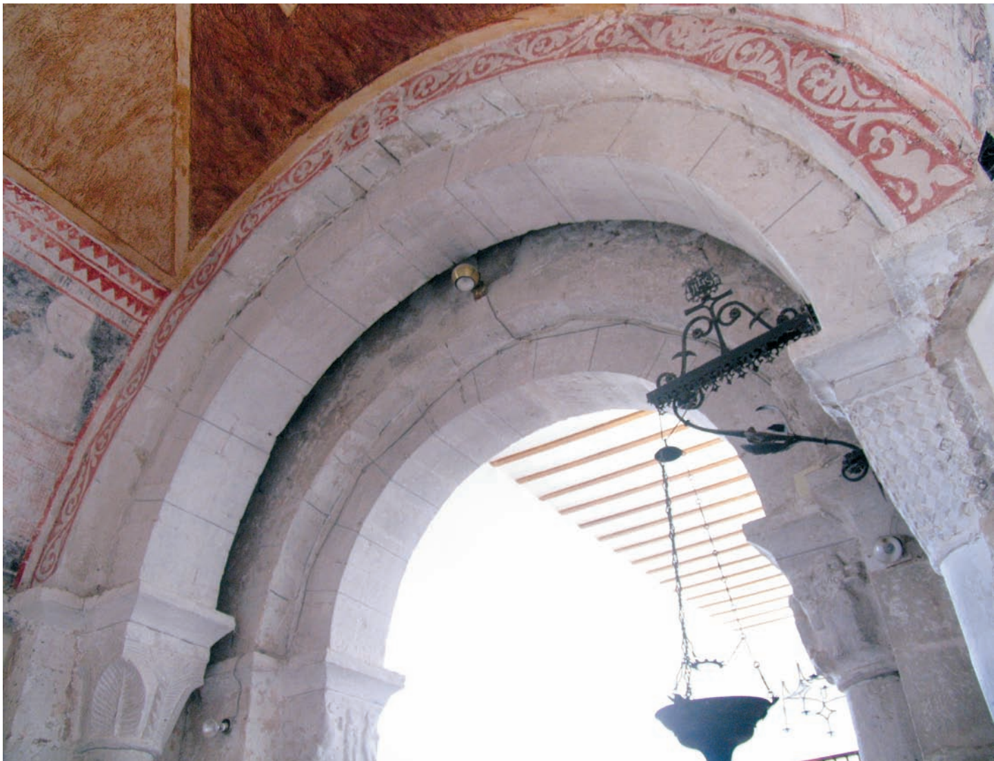
Organización de los dos arcos triunfales

tiéndose también la presencia de una leve incisión que distingue el listel de la nacela. Apean estos arcos en jambas acodilladas que albergan unas columnas de achaparrado canon, todo ello sin ornamentar; las cestas de los capiteles troncocónicos tampoco presentan decoración, mientras que sobre estos corre una imposta del mismo perfil visto en cornisas y chambrana.