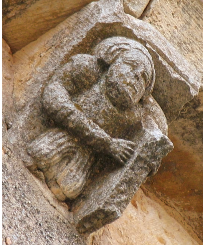
Canecillo de la cornisa meridional