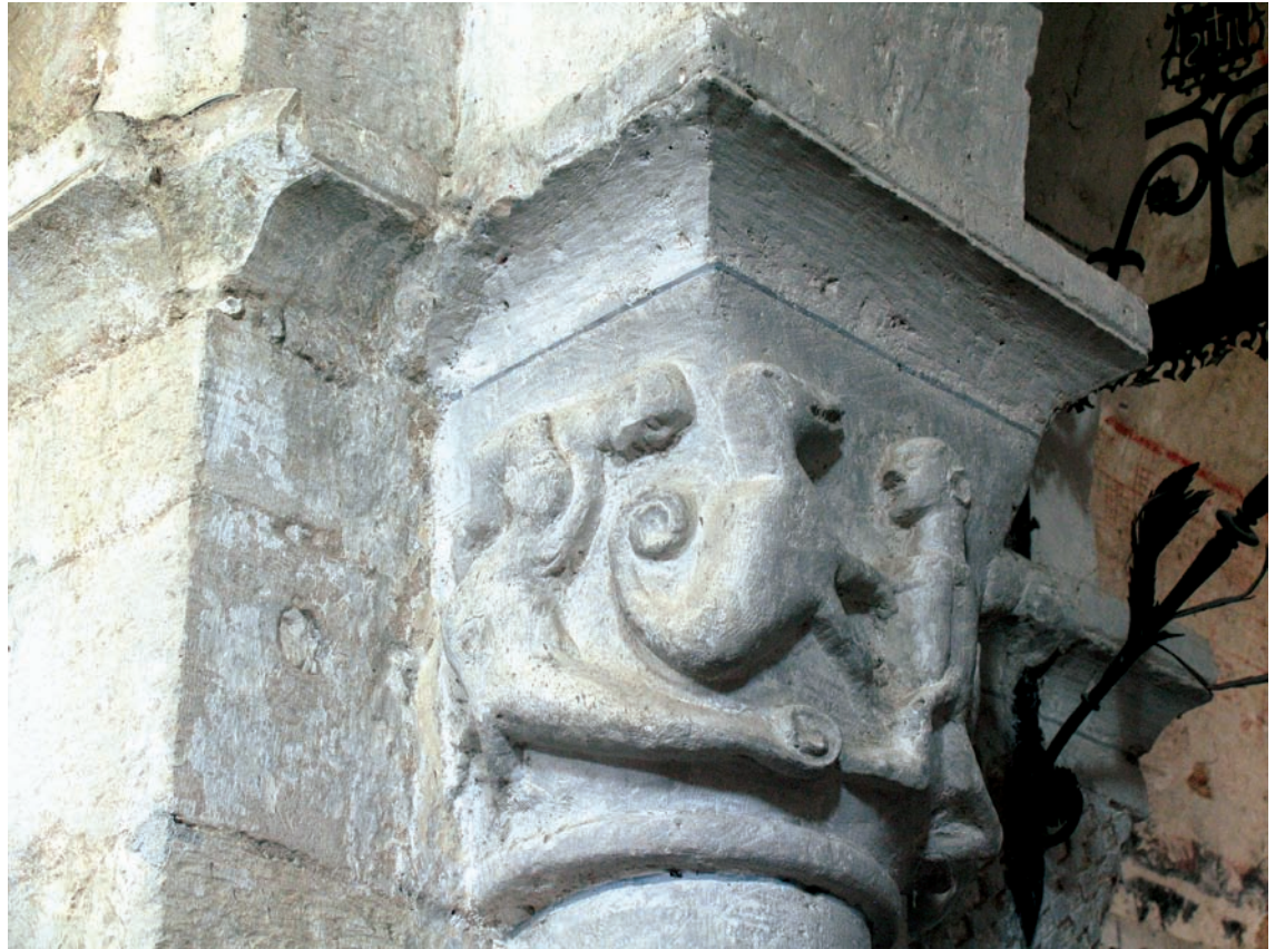
Capitel del arco triunfal