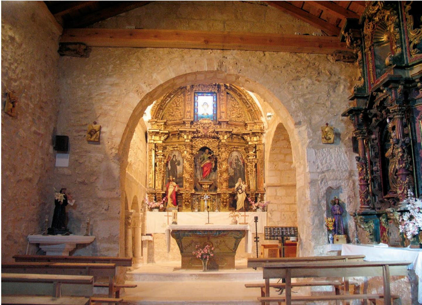
Interior de la iglesia

una nave, con cabecera recta y acceso meridional, al que posteriormente se le fueron añadiendo la torre, el pórtico de mediodía, así como la prolongación de la nave en su parte occidental. Se conserva un vano cegado en la cabecera, siendo este un estrecho hueco rematado en la parte superior por una forma semicircular, careciendo de cualquier motivo ornamental; al interior este vano queda oculto por el retablo, funcionando otro cuadrangular situado sobre él a modo de transparente. En el muro septentrional, realizado con los materiales ya citados, se conserva aunque removida, la cornisa pétreo que cuenta con perfil abiselado, salvo una pieza que lo tiene de nacela.