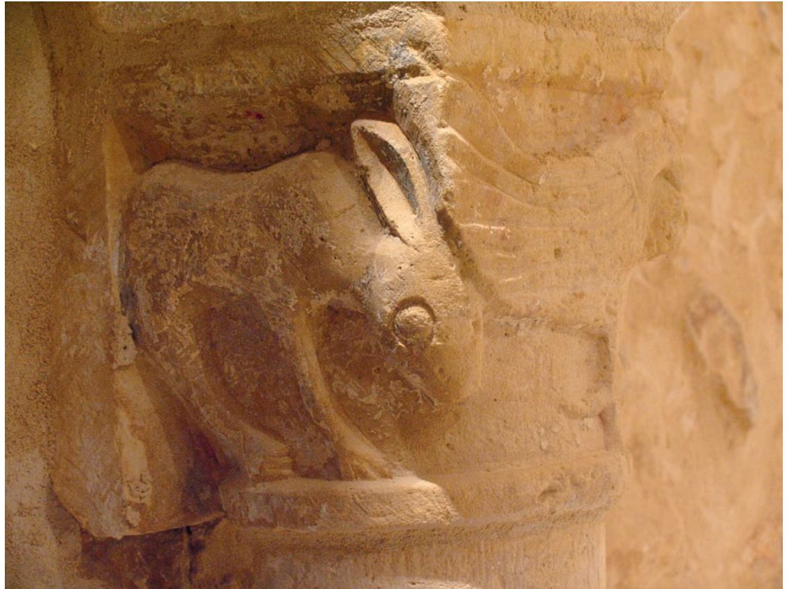
Detalle de un capitel de la arquería del presbiterio