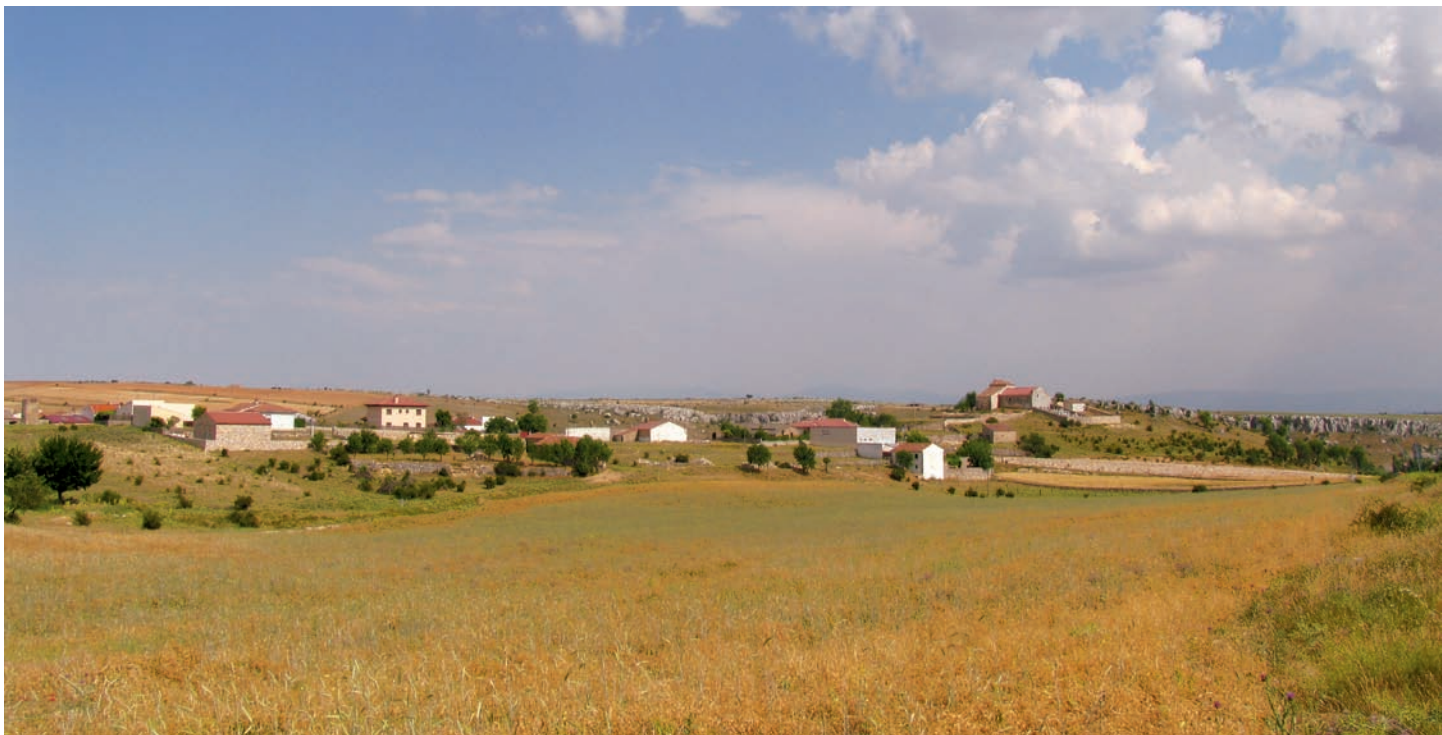
Vista general de la localidad

A comienzos del siglo X, tras la batalla de Simancas, 939, Ramiro II dispuso que Fernán González debía repoblar Sepúlveda y el extenso territorio a esta villa correspondiente; por su parte, Asur Fernández organizó toda una serie de fortificaciones que protegían el camino que unía diferentes núcleos, como eran Peñafiel, Roa o la propia Sepúlveda. A esta estrategia responde la ubicación de núcleos cercanos con nombres de significado tan evidente como Castrojimeno o este de Castroserracín, "Por cierto que argumento pintiparado en pro de una índole castrense del pasado de toda esa parte del valle", en palabras de Linage Conde. Por su parte, para la segunda repoblación, Barrios García propone origen castellano para las gentes aquí venidas. El asentamiento aparece en el documento por el que el cardenal Gil de Torres, en 1247, fijaba las cantidades que debían aportar las distintas parroquias al sostenimiento común; de esta manera se encuentran referencias a Castiel Serrazin que debía abonar, junto a Val de Chenna –hoy despoblado en este término, junto a La Torre–, XXIII moravedis et VIII soldos et medio ; ha pertenecido al ochavo de La Pedriza, dentro de la comunidad de Sepúlveda y se erigió como parroquia en 1783 por apreciarse su vecindario considerable, con 62 vecinos.