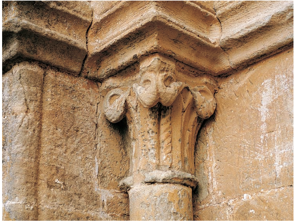
Capitel de la portada

ermita o iglesia ya que precediendo a esa portada han aparecido varias sepulturas de lajas, demasiado apartadas para vincularse a la actual parroquia.