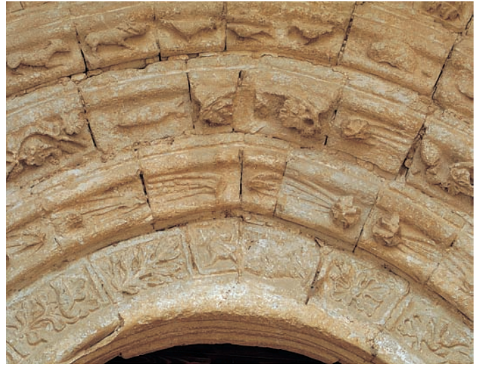
Arquivolta de la portada