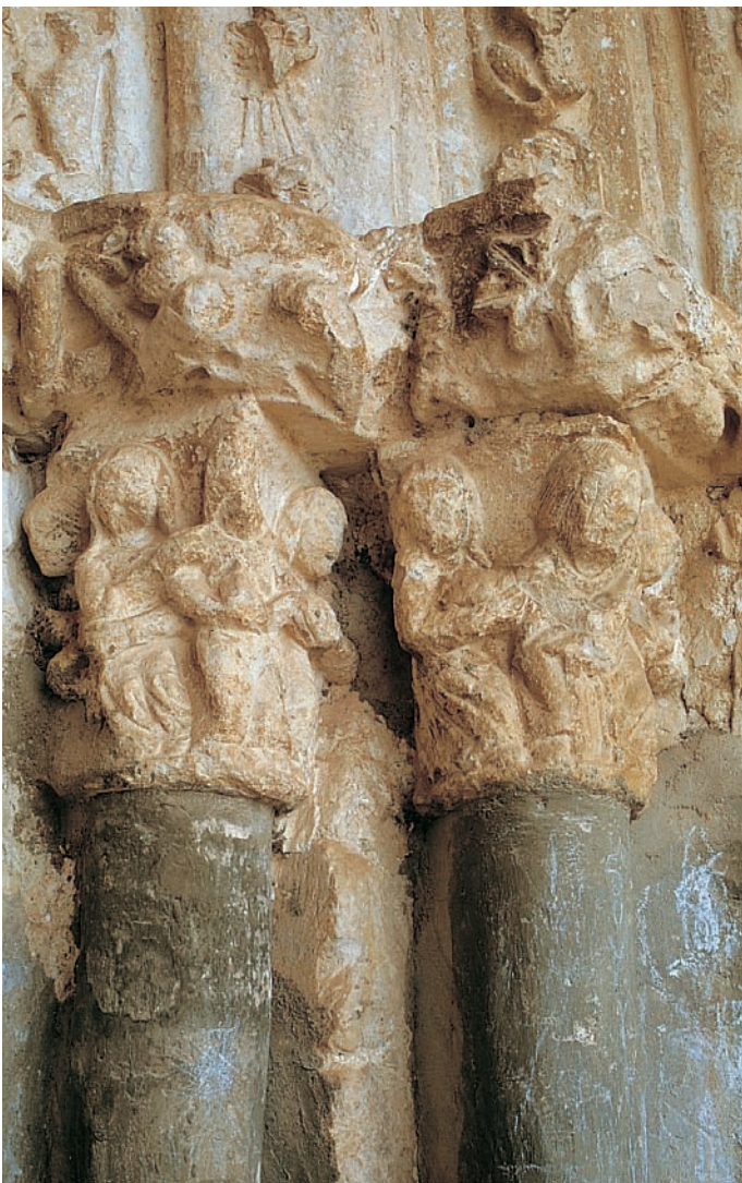
Capiteles de la portada

Se custodian en el interior de la parroquia dos imágenes de la Virgen con el Niño, ambas de finales del siglo XIII. Una de ellas, la Virgen del Valle, se conserva en un retablo del lado de la epístola muy restaurada y repintada. La otra está instalada en un retablo barroco de la nave del evangelio. Ambas son de madera policromada y pertenecen al tipo de Virgen maternal con el Niño sentado sobre la rodilla izquierda de su madre y bendiciendo con la mano derecha.