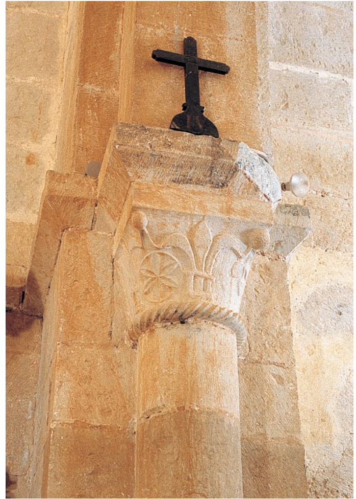
Capitel del interior