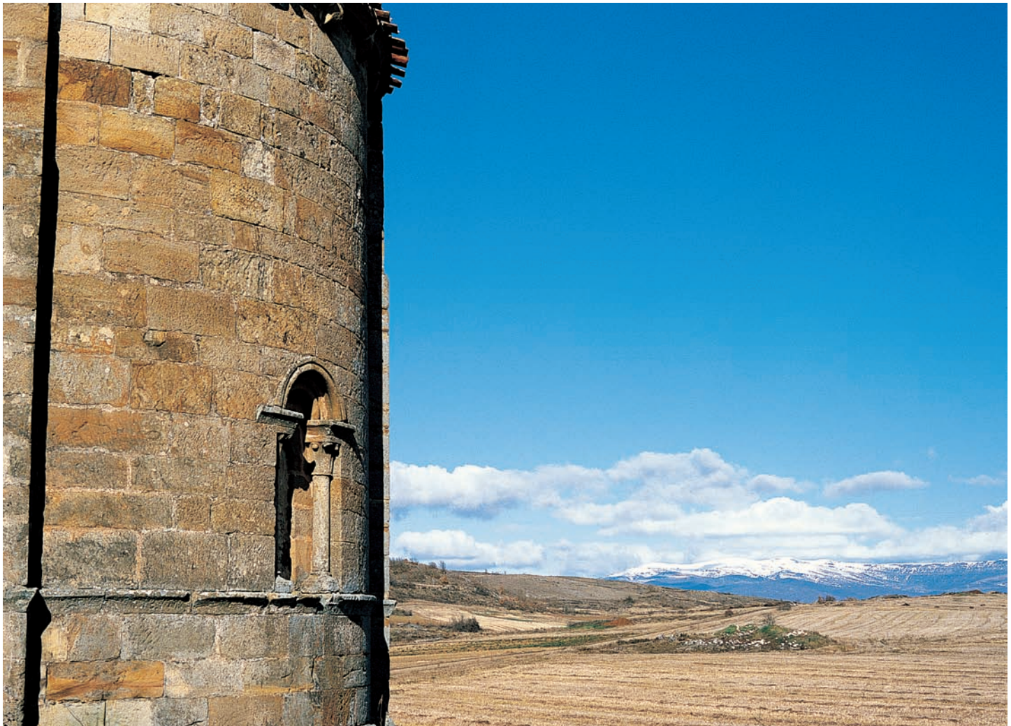
Detalle del ábside y panorámica

una ventana –hoy cegada– de arco de medio punto sostenido por columnas. A la altura del alféizar corre una imposta de caveto que abraza todo el perímetro absidal. A los pies del templo se levantó la espadaña de dos vanos y remate recto, recorrida por una sencilla moldura a modo de imposta.