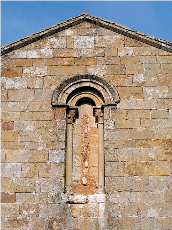
Ventana del ábside

en las esquinas. La estructura de esta torre, de cronología posmedieval (fines del siglo XVI), enmascara el cuerpo occidental del templo románico y su portada, debiendo realizarse el acceso a través de la puerta de la torre. En el muro oriental del campanario se observan rozas de un primitivo