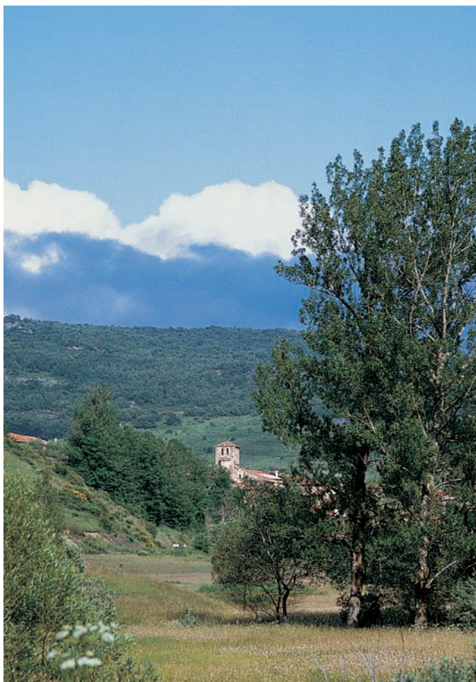
Celada de Roblecedo