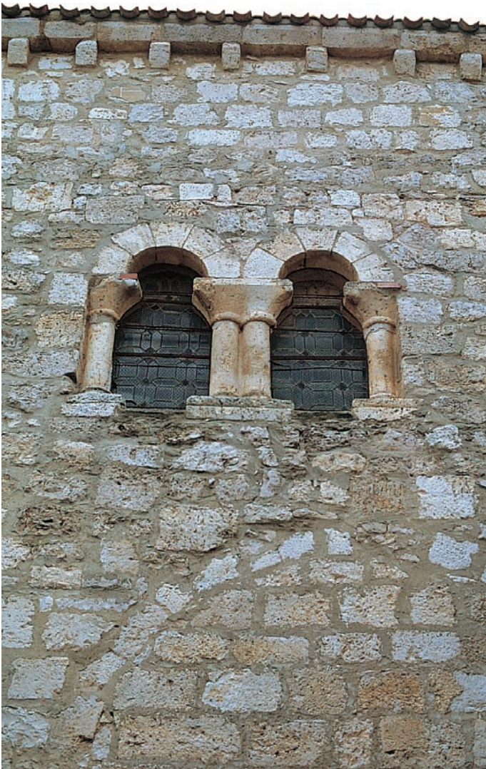
Ventanal del bastial occidental

de la que, en los libros parroquiales del XVII, se denominaba sacristía vieja. En la nave del evangelio pueden verse dos arcos de medio punto superpuestos y cegados que darían acceso a esta dependencia. Los pilares de hormigón y el cubrimiento de las naves son fruto de obras posteriores que se prolongaron hasta 1973.