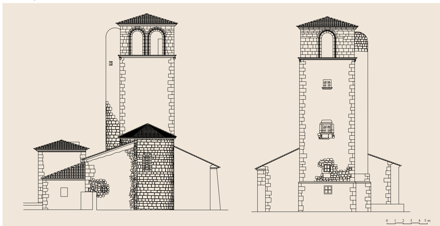
Alzados este y oeste