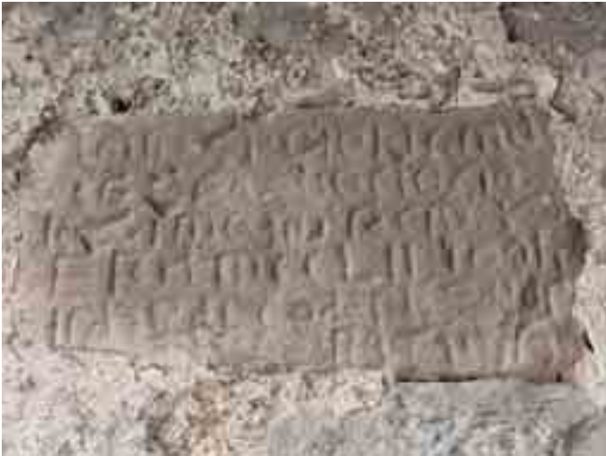
Inscripción, en el muro de entrada, sobre la consagración de la iglesia (año 1222)