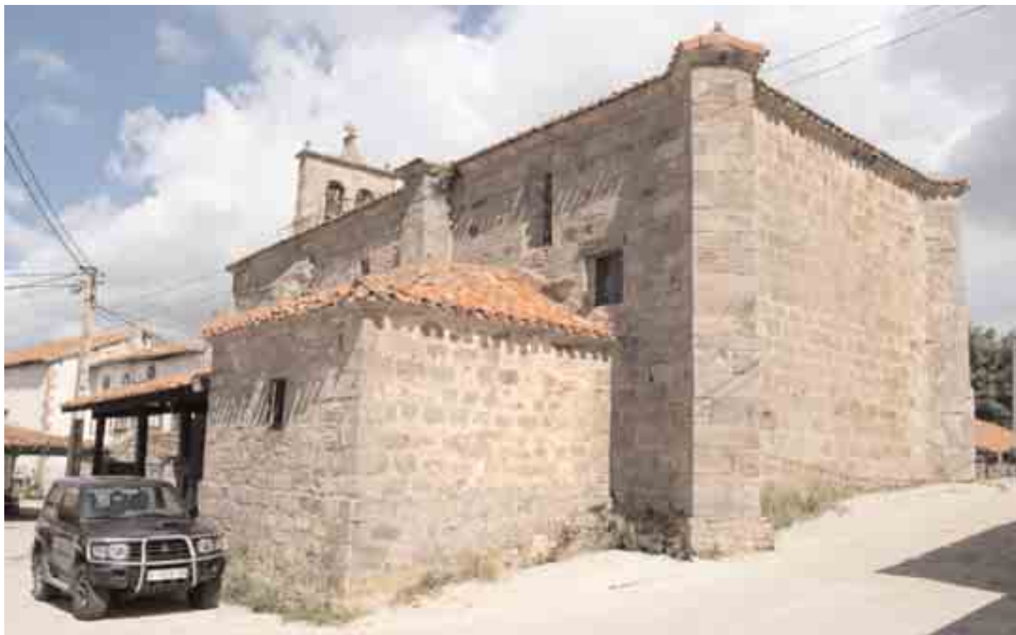
Aspecto exterior de la iglesia actual

(1214). La inscripción es muy tosca y muy desgastada. Se aperciben las eses de dos tipos: cuadrada y uncial. Escagedo, que vio la lápida, y la fotografió para que Fita la publicase, se refiere a ella en los siguientes términos: "No he de citar aquí la lápida de consagración de la iglesia de Villapaderne, mi primera parroquia... corresponde al año 1214, en que Mauricio, obispo de Burgos, dedicó la iglesia a San Emeterio...". En la nota, a pie de página, da la siguiente