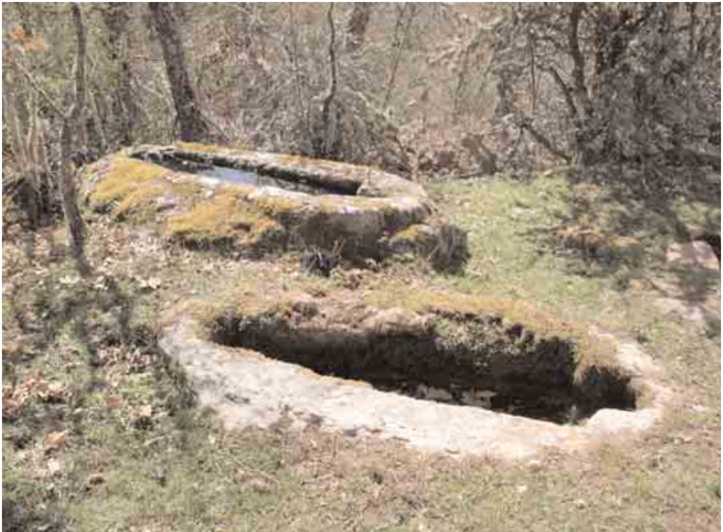
Tumbas rupestres en sus proximidades