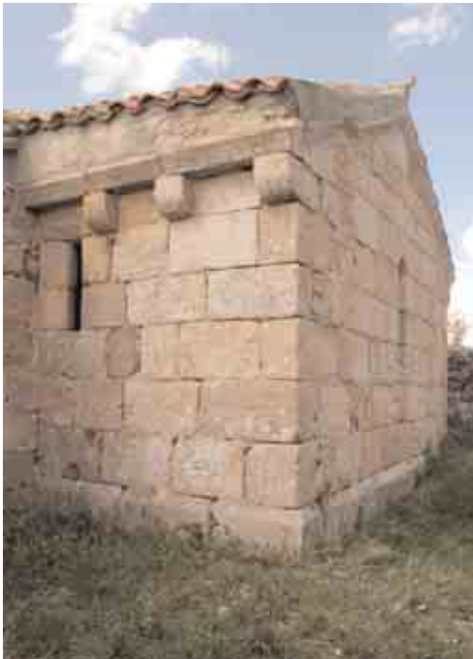
Muros sur y este de la capilla absidal