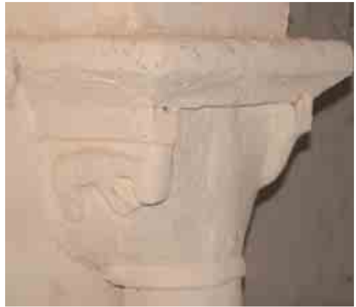
Arco triunfal. Detalle del capitel de la columna derecha