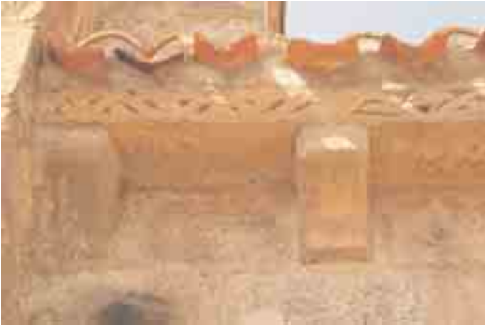
Canecillos 1 y 2 de la cornisa meridional, y cornisa decorada con trenzado de perillas