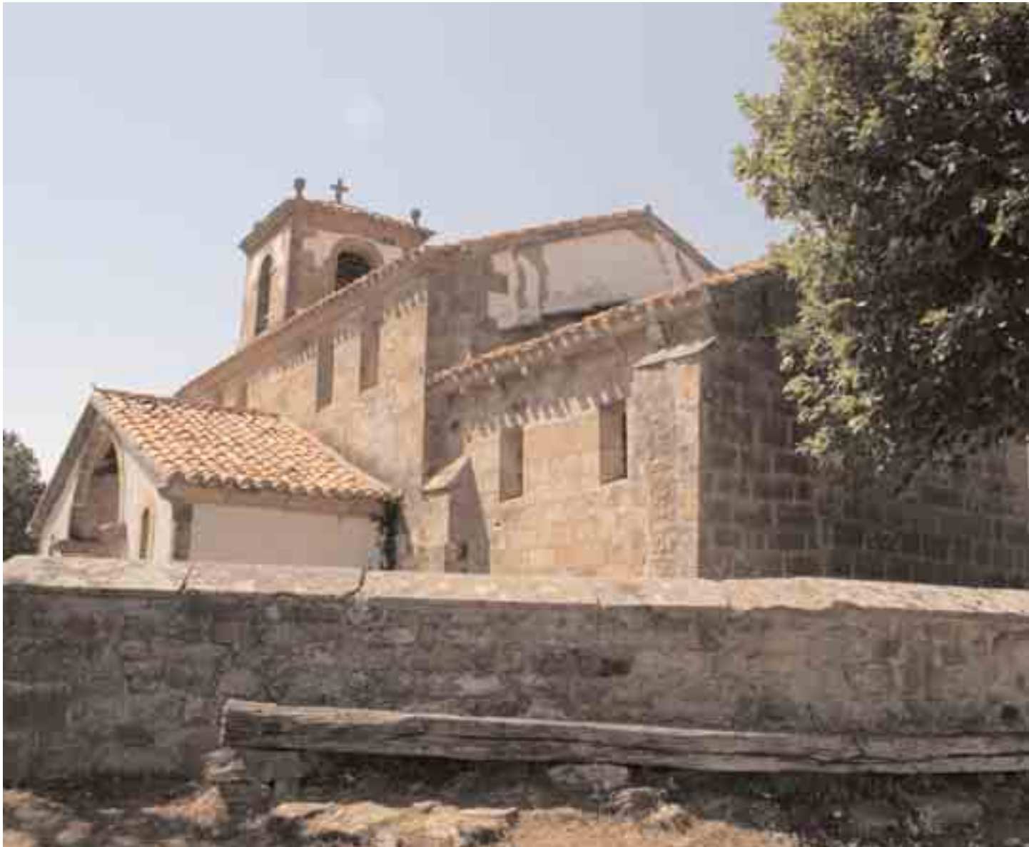
Vista general de la iglesia

cambio radical, elevándose algo y abriendo en el muro sur, ventanales rectangulares. Las huellas románicas mejor conservadas, aún pueden verse en la capilla absidal, que ofrece una cornisa románica, muy bien tallada, con una banda serpentiforme y perlada que va envolviendo hojas, muy parecida a la que vemos en los cimacios de la puerta de la parroquia de Arcera. En Loma Somera está sostenida por canecillos en caveto. Otras reformas afectaron también a esta capilla, pues en su muro sur se abrieron dos ventanas rectangulares que nada tienen que ver con las clásicas románicas.