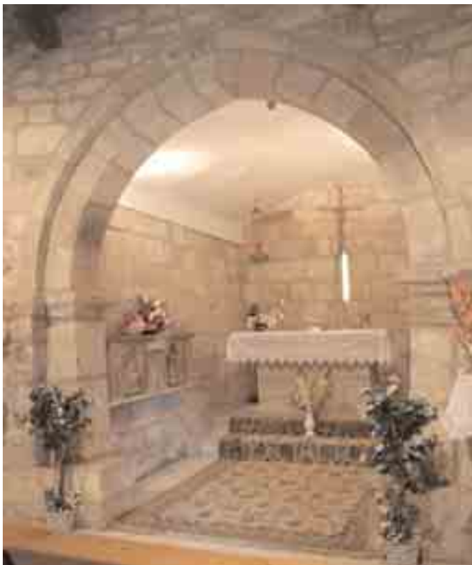
Interior. Arco triunfal

El interior de la iglesia, tal como ahora vemos, tiene cañón rebajado para el ábside, todo enlucido, que apoyaba sobre muros de grandes sillares. El arco triunfal es doblado y apuntado y carga sobre cimacios biselados que, a su vez, lo hacen sobre pilastras prismáticas, de sólo dos buenos sillares, que reposan sobre otro más ancho y horizontal. La cubierta de la nave es de madera. En el interior del ábside, a su izquierda, se conserva una predella de un viejo retablo policromado del siglo XVI, con puerta de Sagrario que lleva tallado a Cristo resucitado y dos evangelistas a los lados. Suponemos que esta interesante ermita pudiera haberse levantado en los años correspondientes a la primera mitad del siglo XIII. No conserva pila románica.