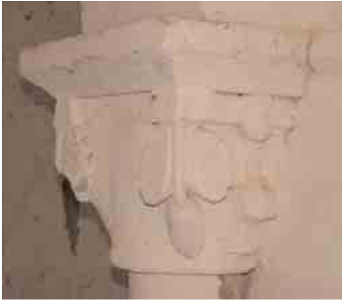
Columna izquierda del arco triunfal, detalle del capitel