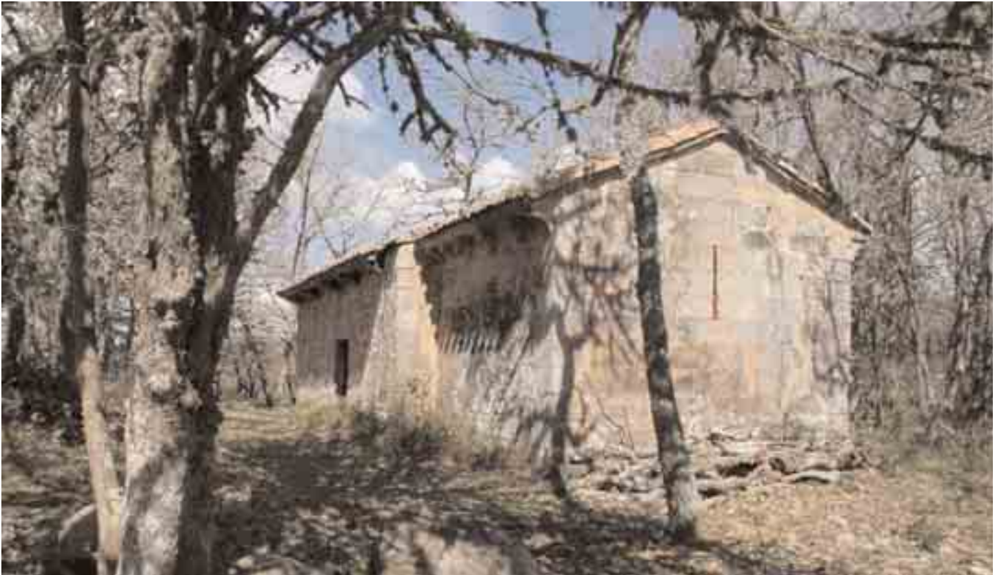
Exterior de la ermita rodeada del bosque de robles