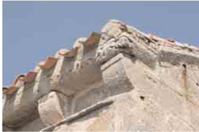
Canecillos 7 y 8 de la cornisa meridional, con la consiguiente decoración