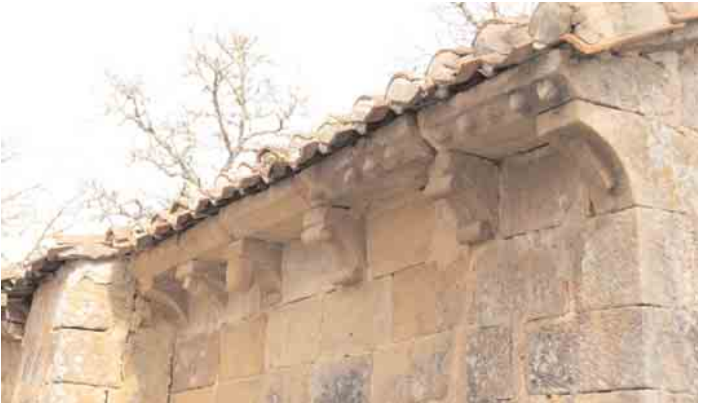
Cornisa y canchillos del muro sur de la cabecera