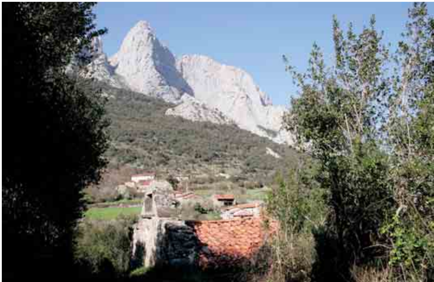
Vista de la ermita con el pueblo al fondo

los primeros vigilantes del desfiladero. Se trata de Allende, Cabañes y Pendes. Los tres tienen iglesias que han sido modificadas posteriormente, pero que guardan vestigios románicos en sus alzados renovados. En Allende, dada la