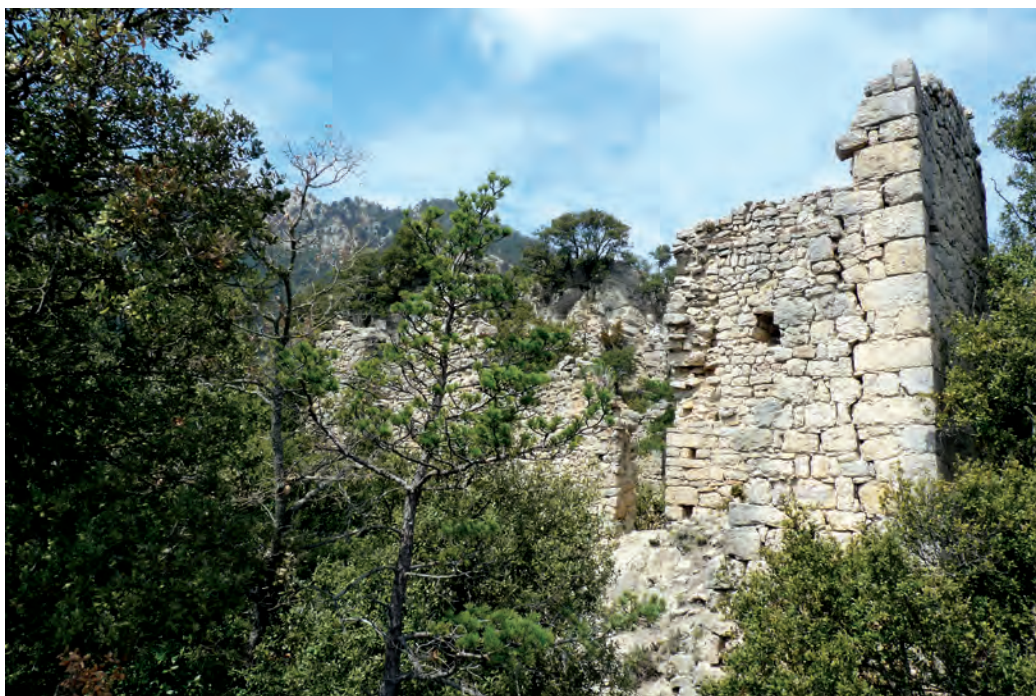
Restos del castillo