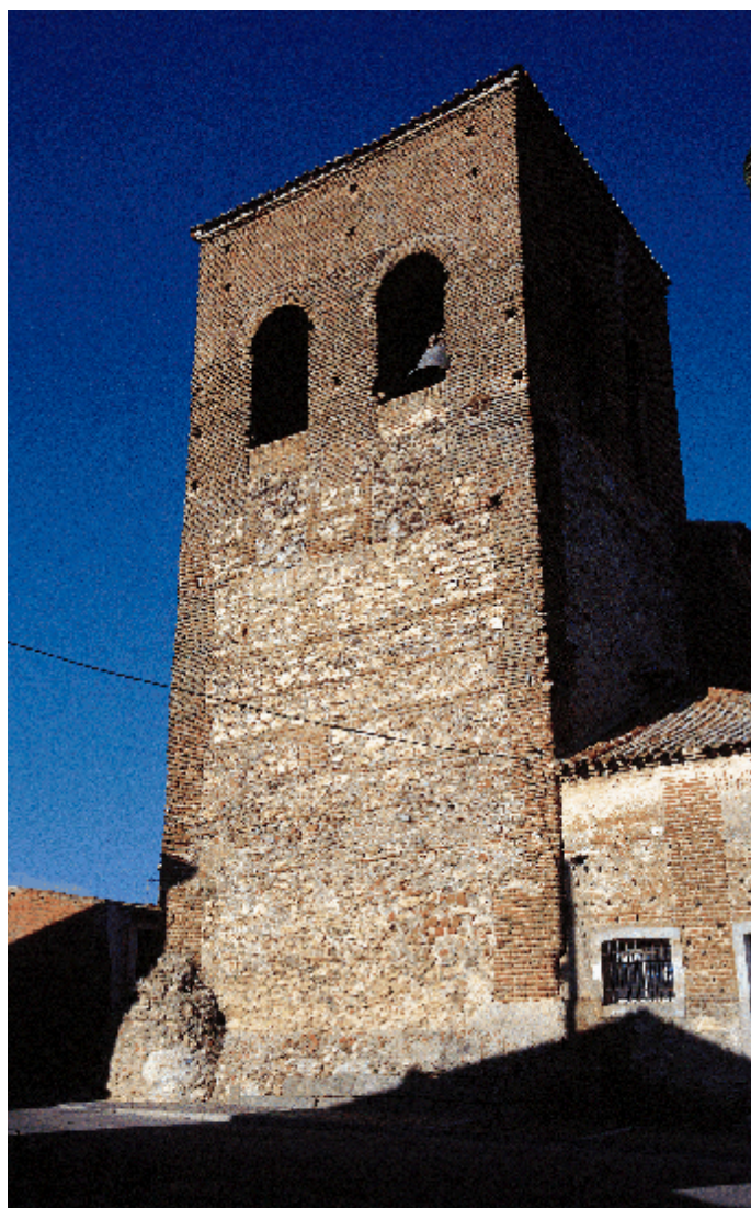
La torre almenara