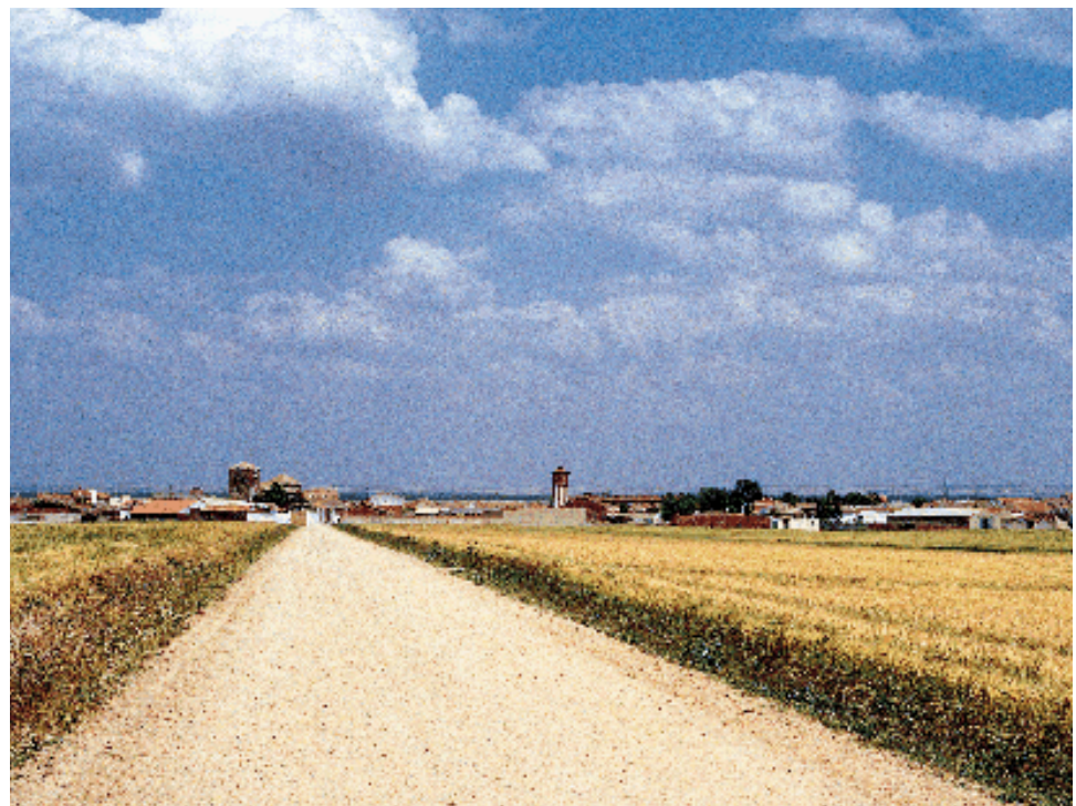
Palacios de Goda

Estudio histórico: IHGB - Estudio artístico: JLGR Plano: MTST