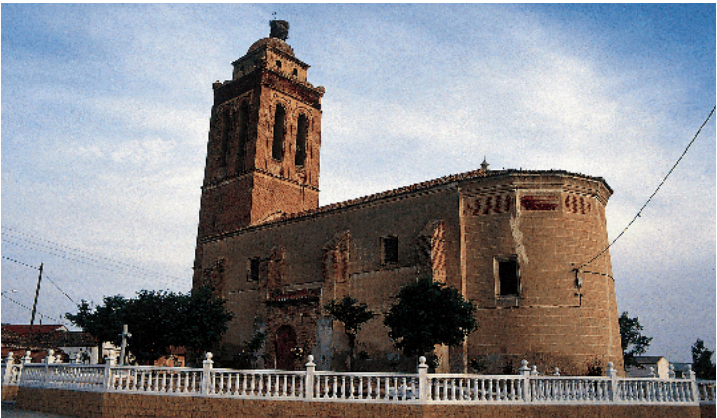
Exterior del templo

No es mucho lo que queda original después de múltiples intervenciones y reformas, especialmente en los siglos xv y xvi. Una puerta en la fachada septentrional, en la actualidad cegada y tapada por un contrafuerte posterior,