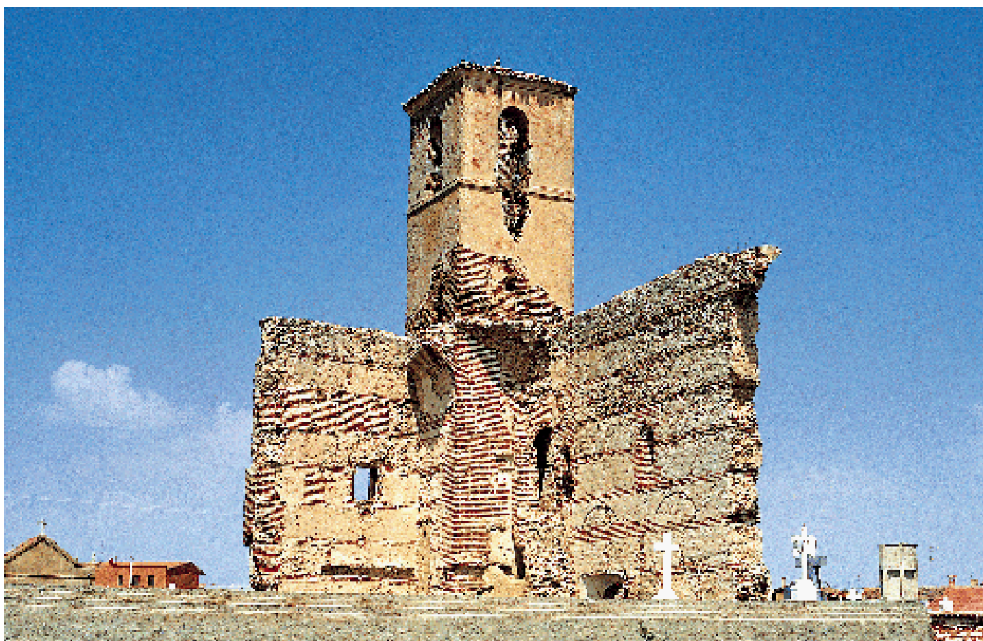
Exterior de las ruinas

guo templo que hoy están reducidos a parte de los muros y de la torre, pero suficientes para percibir el seguimiento de las técnicas y materiales constructivos de la comarca, con cajones de mampostería y presencia de ladrillo. Se