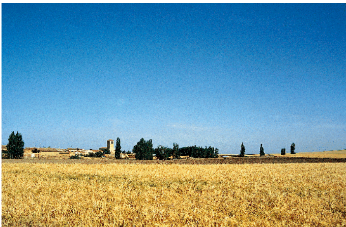
Flores de Ávila