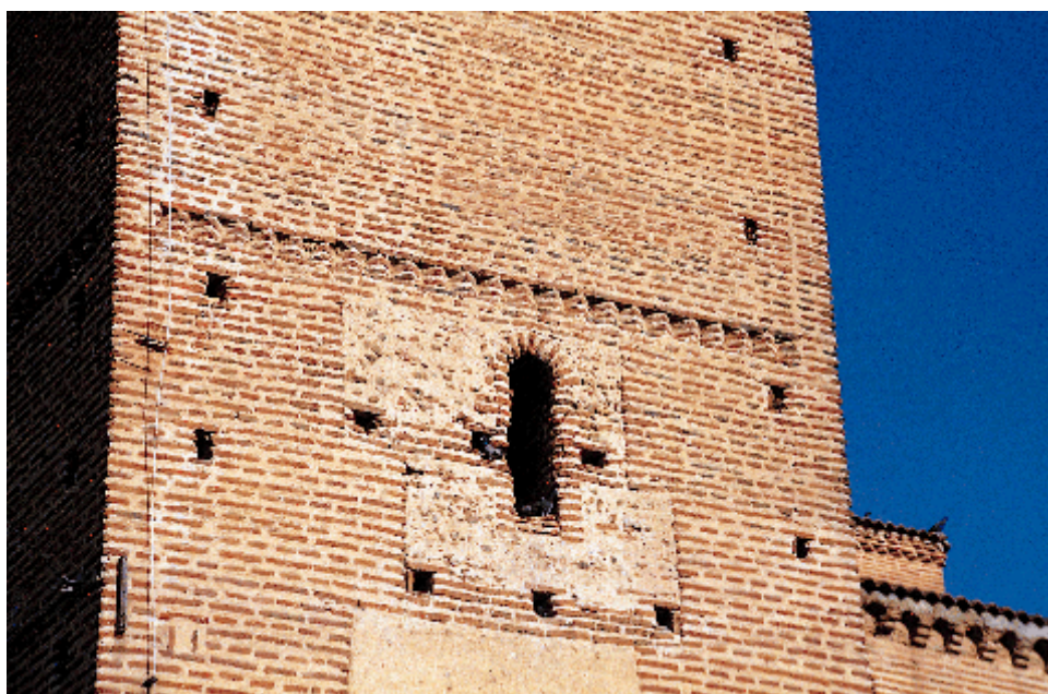
Detalle de la torre

la espadaña que hoy están cegados y, como en el cuerpo inferior, todavía son visibles los mechinales que se emplearon en su construcción. Un nuevo friso de esquinillas da paso al cuerpo de campanas, también de ladrillo, con dos vanos por flanco de estilizados arcos de leve herradura y apuntados, con alfiz rehundido.