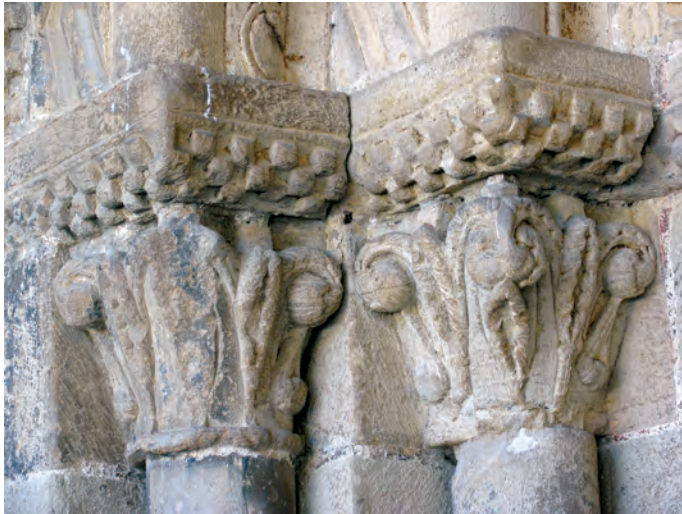
Capiteles del lado derecho de la portada