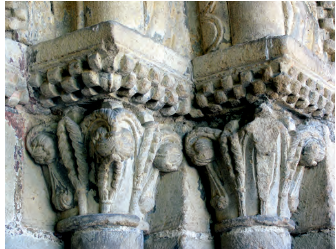
Capiteles del lado izquierdo de la portada

mediante una línea vertical con otras tres incisiones horizontales.