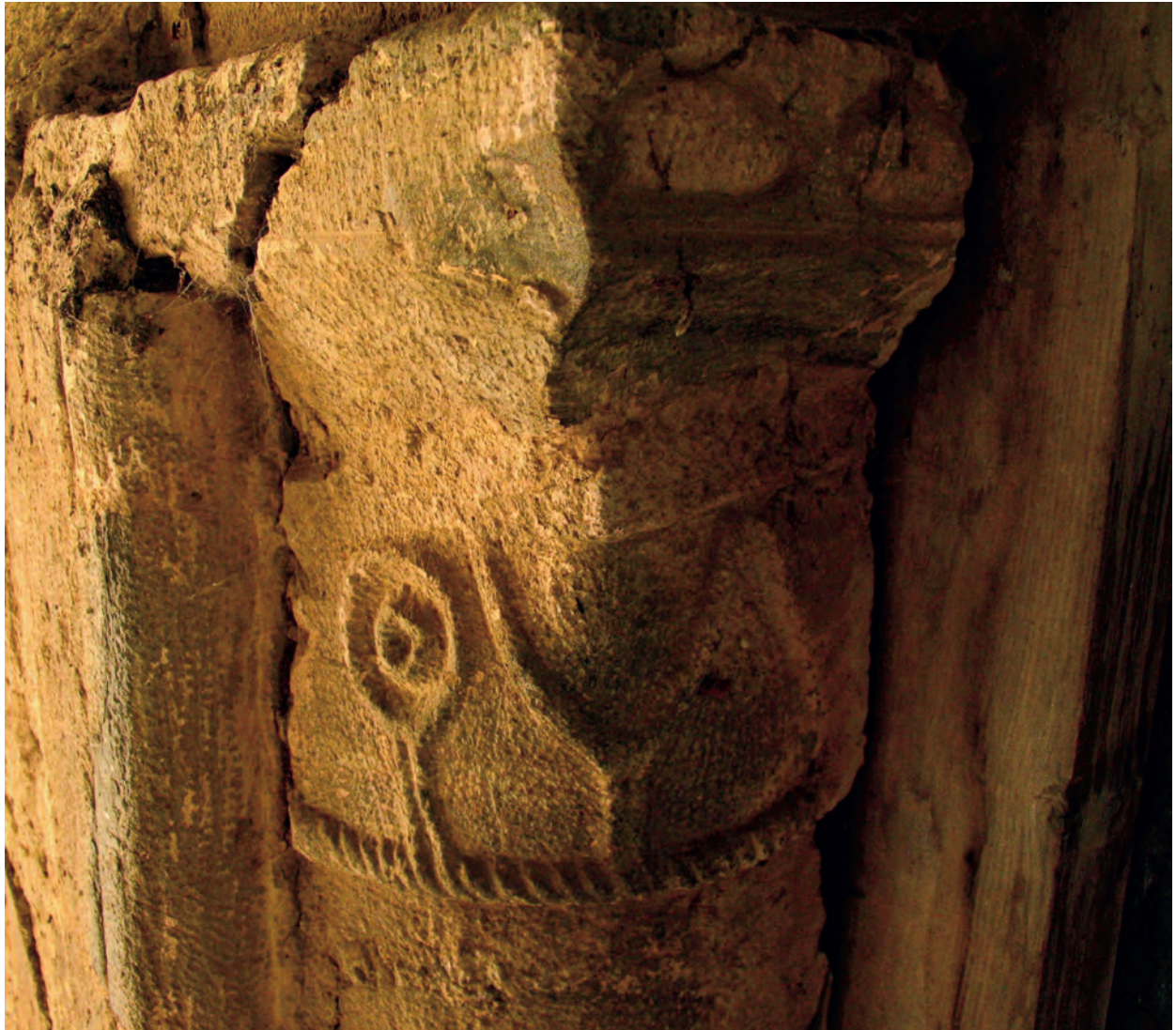
Capitel de la portada oeste

En el interior, Villaverde no presenta ningún tipo de complejidad estructural. Su arco triunfal es apuntado, su capilla cuadrada se cubre con bóveda de cañón de similar disposición apuntada. En el lado oeste tiene añadida una capilla, y en el lado norte de la cabecera una sacristía. La iglesia, según indica una inscripción conmemorativa alojada sobre la portada, fue reformada en 1713 reinando Felipe V.