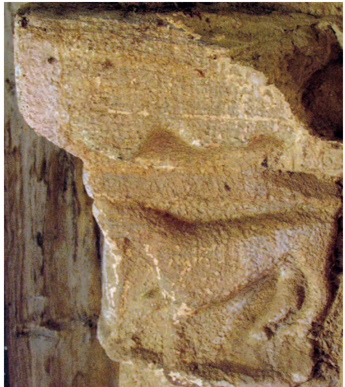
Capitel de la portada oeste

mantiene una estrecha relación con las representadas en el capitel derecho del arco triunfal en Celón, que adquieren la misma postura y complexión.