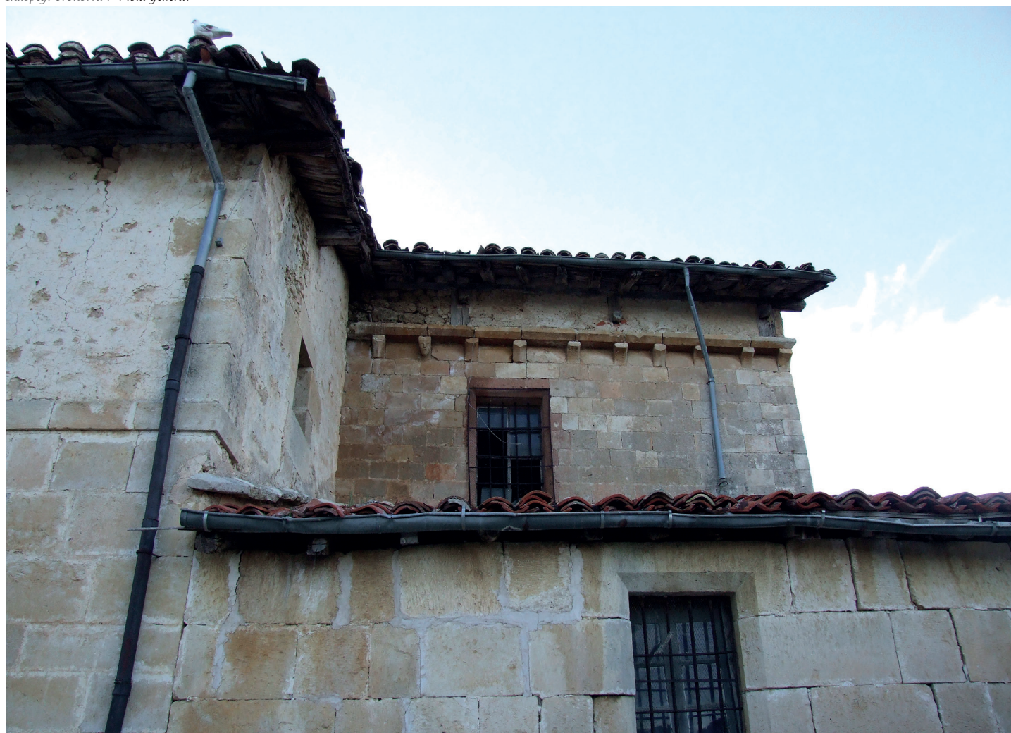
Ikuspegi orokorra / Vista general