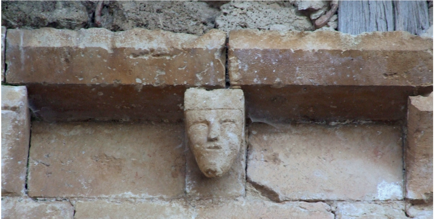
Harburua / Canecillo