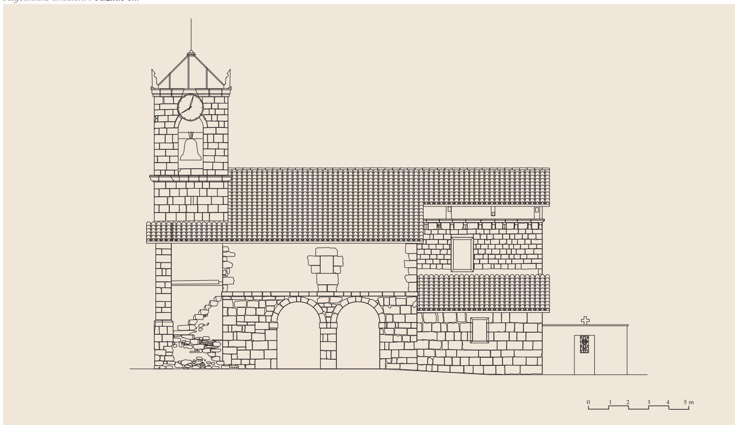
Hegoaldeko altxaera / Alzado sur