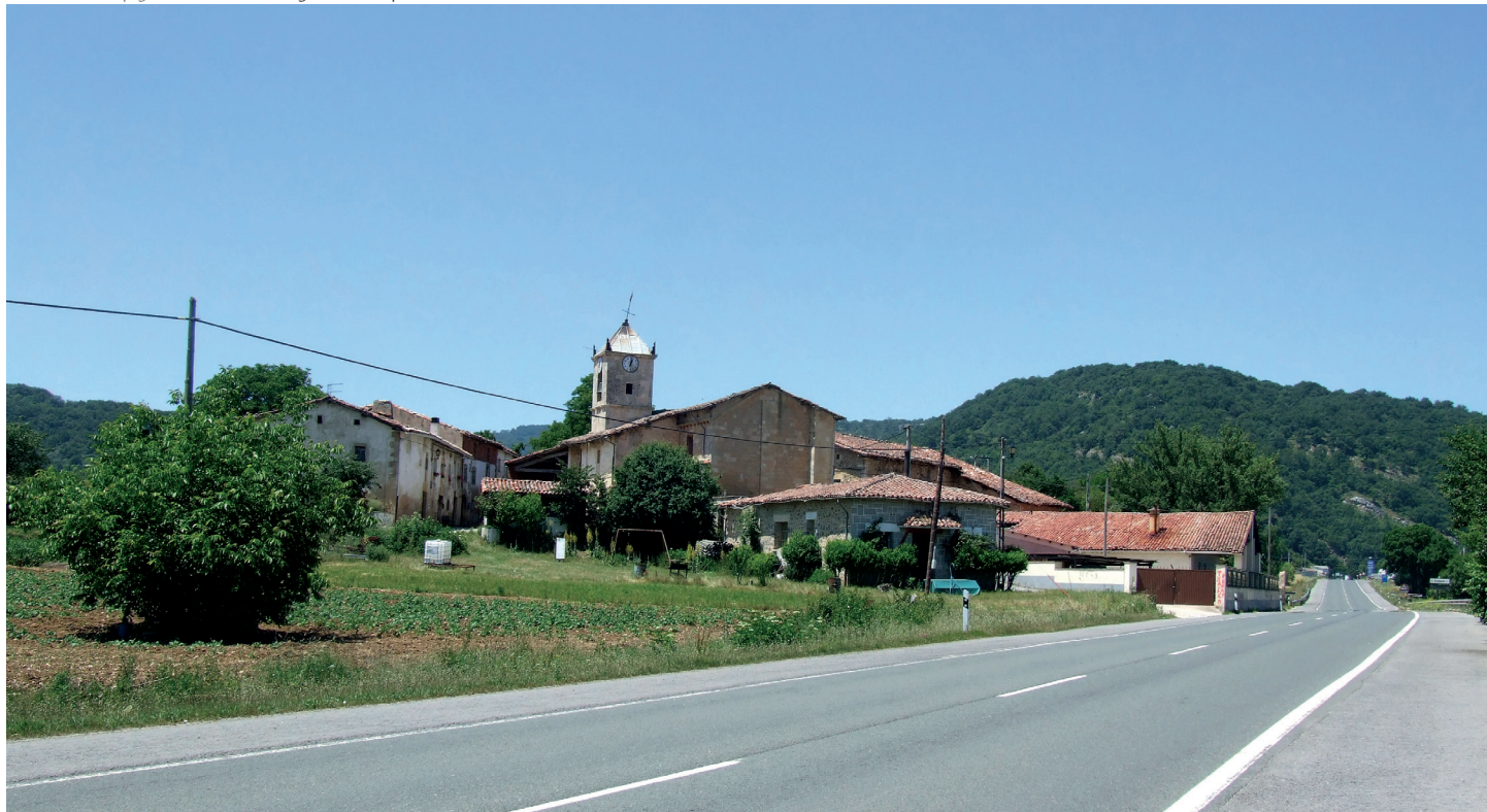
Herriaren ikuspegi orokorra / Vista general del pueblo

Vírgala Menor formó parte del señorío de los Gaonas, al igual que las cercanas localidades de Azáceta, Vírgala Mayor, Maestu y Atauri. Tuvo también su importancia histórica, ya que era aquí donde se celebraban las juntas de la Hermandad de Araya y Laminoria, entonces integrante de la Cuadrilla de Salvatierra a efectos forales. Esas reuniones tenían lugar en una sala adjunta a la desaparecida ermita de San Adrián.