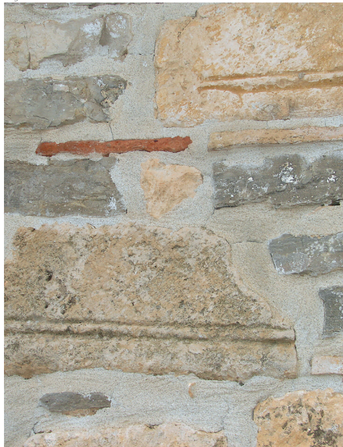
Hegoaldeko hormako xehetasuna / Detalle del muro sur