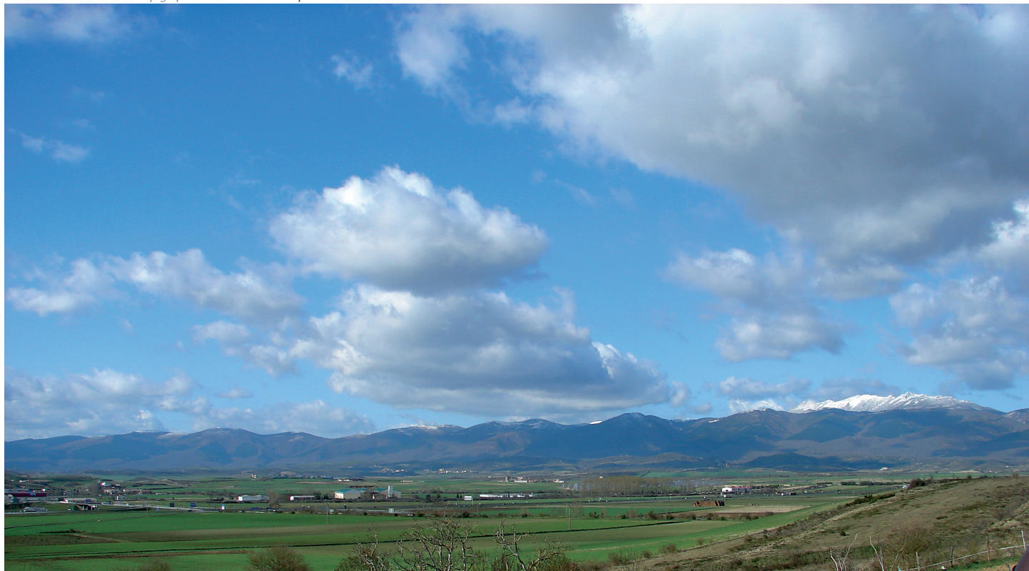
Arabako Lautadaren ikuspegi panoramikoa / Vista panorámica de la Llanada Alavesa

El primer día de agosto del año 1564, Salvatierra sufrió el azote de un incendio, quemándose