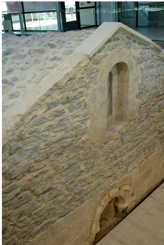
Burualdea / Cabecera