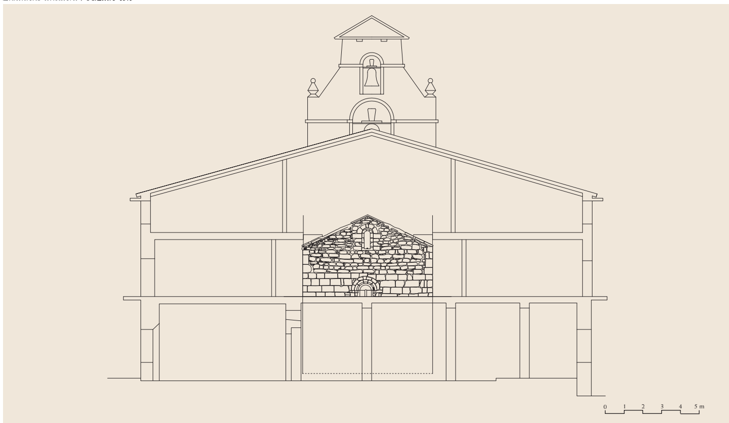
Ekialdeko altxaera / Alzado este