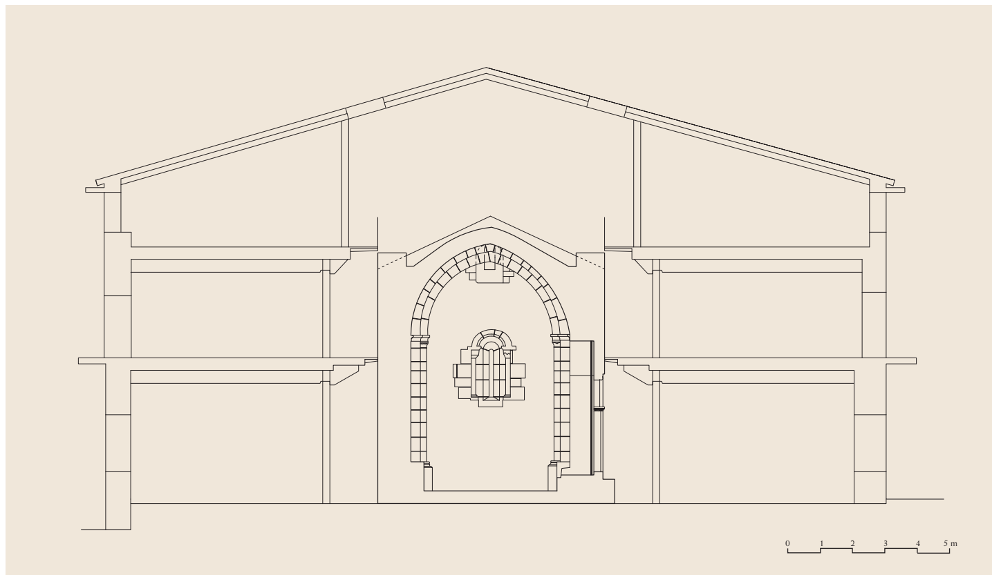
Ebaketa zeharka / Sección transversal