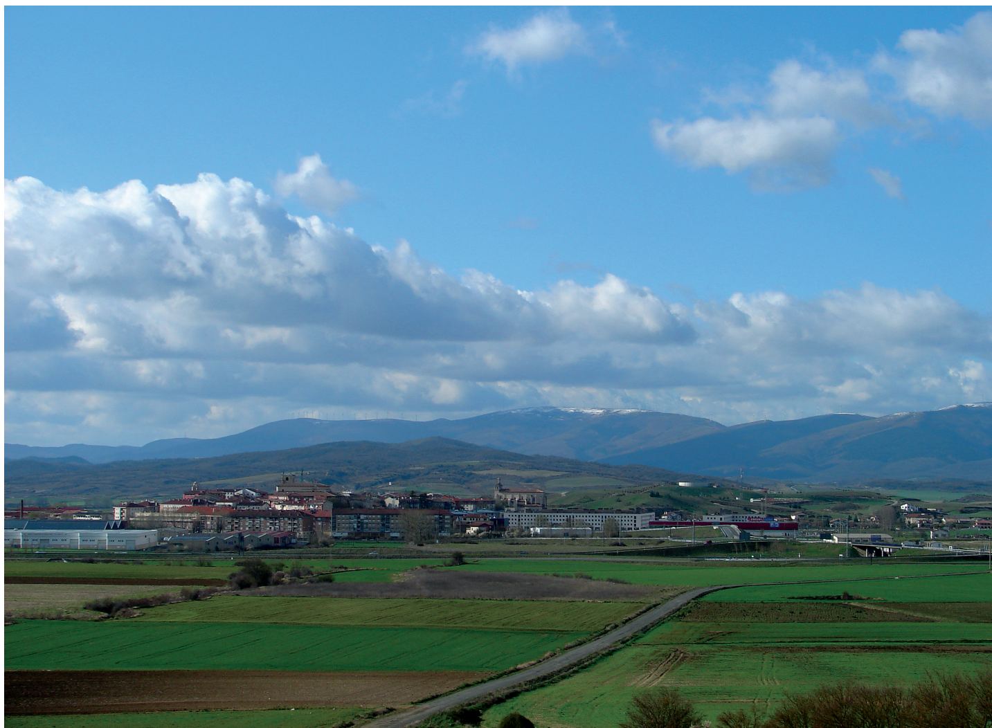
Herriaren ikuspegi orokorra / Vista general del pueblo

tuzte; XI. mendekoa itxura batean, erdiko nabe bat zuen, absidea eta elizpea—. Beste basiliza hauek ere izan ziren: Aranako Andre Maria, Arrizabalaga ondoan; Andra Mari, Egileor ondoan, eta San Migel, Alanguan. San Jurgiren omenezko beste basiliza bat ere egon zen, gaur egun galduta. XIII. mendetik, berriz, Salurtegiko Andre Mariaren zati bat eta Ulako Andre Maria iritsi zaizkigu gaur egun arte.