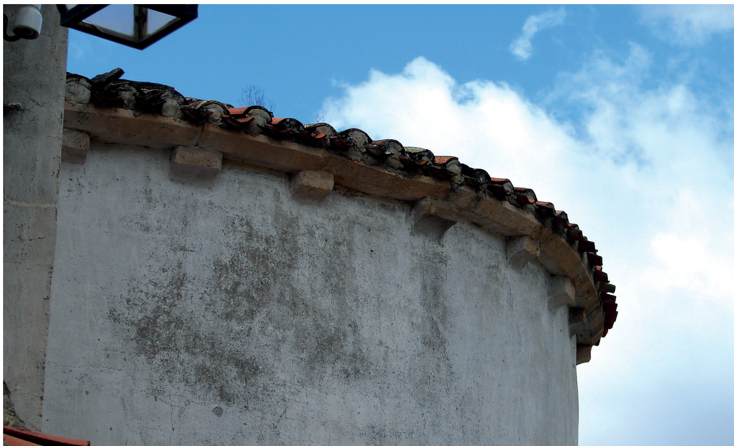
Absideko xehetasuna / Detalle del ábside

lurren artean jaso zituen Langarika, Irazaba eta Soriellako monasterioak. 1446.urtean San Pedroko beatek, Santa Isabelen Araudiaren jarraitzaileek, jarduten zuten basilizan. Beatak Agurainera joan ziren geroago.