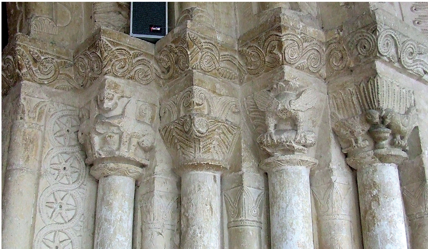
Portadako kapitelak / Capiteles de la portada

lak, zurtoin kurbatsiak dituen beste eraztun baten gainean, aurrez aurre ezarririk, burua falta zaion arrano bat ageri da, untxi bat harrapatzen; ezkerraldean, hosto batzuek landako giroa simulatzen dute. Azken kapitelak, laugarrenak, ertzean kokatutako kopa batetik edaten ari diren bi hegazti erakusten ditu, buruz buru, eta horien gainean, erdiko nerbio perlatsua duten hosto estu eta luzeak.