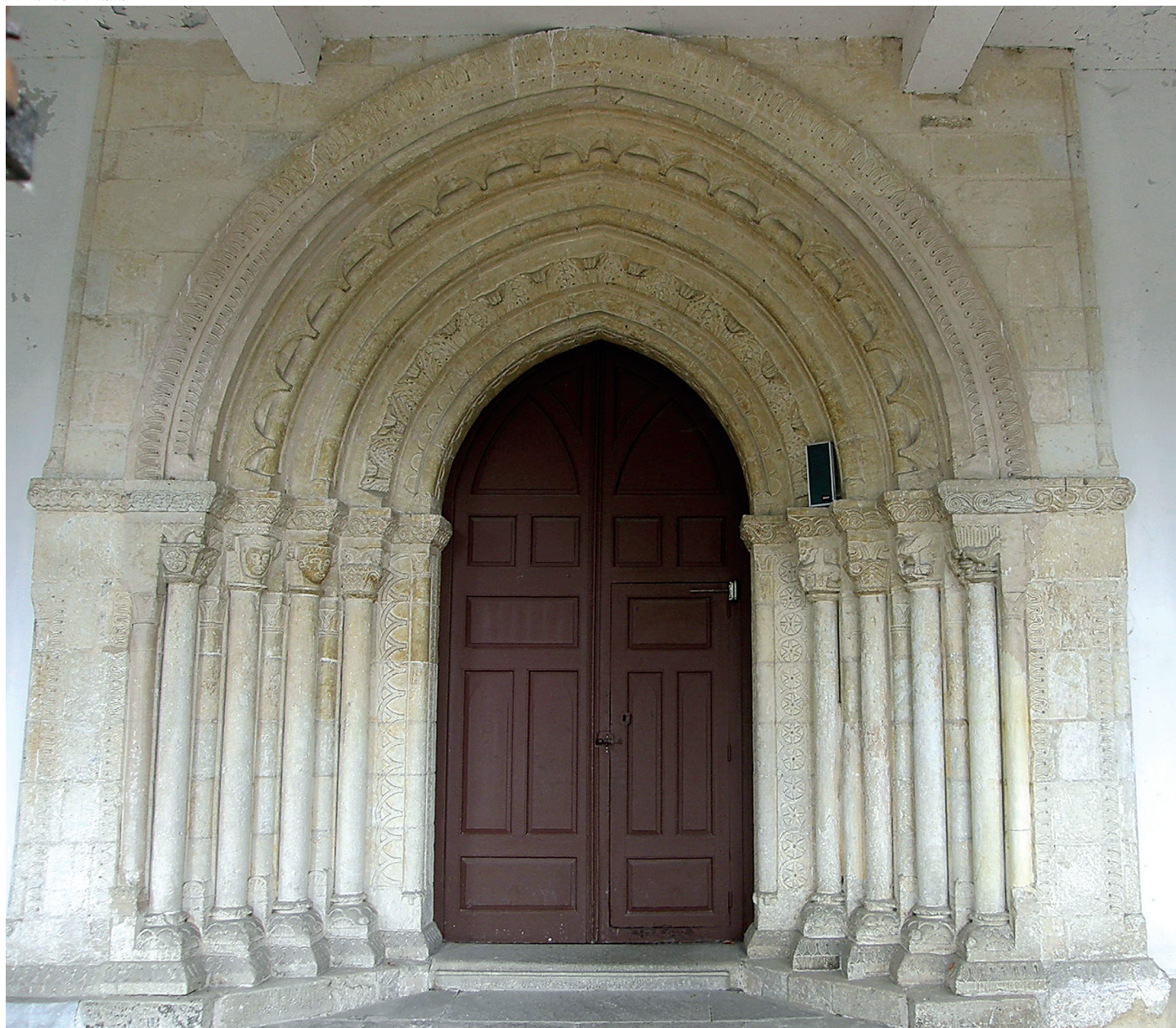
Portada / Portada

En el muro sur, y resguardada bajo el pórtico, se conserva una magnífica portada románica del siglo XIII, que, por la riqueza ornamental de sus elementos, se puede poner en relación con la portada de la iglesia de San