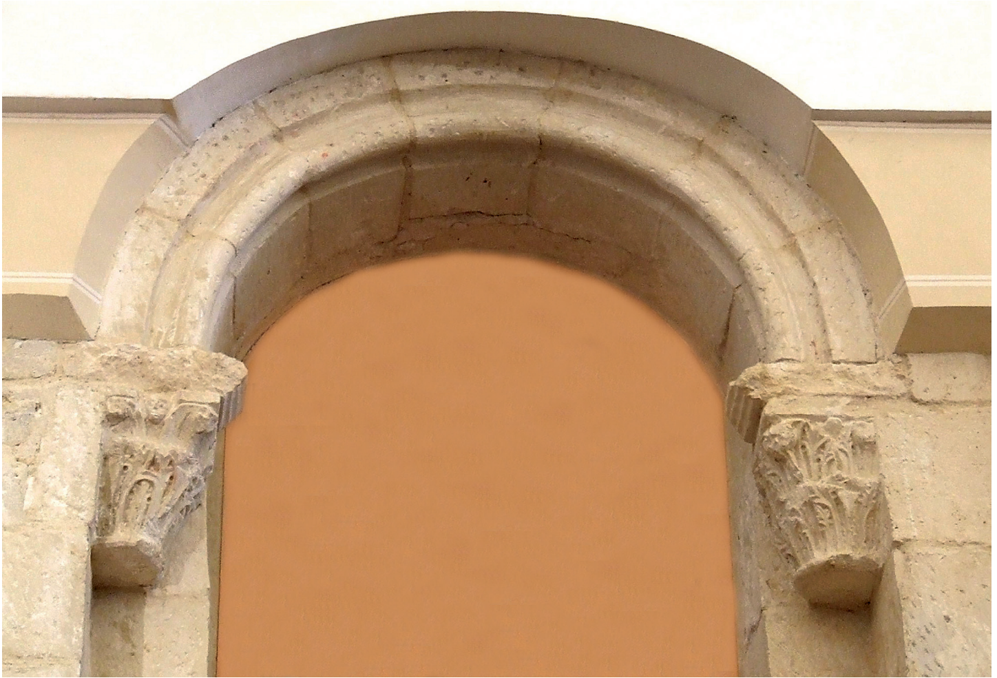
Hegoaldeko hormako leihoa / Ventana del muro sur

dira ere: tenpluak XIII. mendean zuen altueraren berri ematen duten hamalau harburutxo erromaniko, hain zuzen ere. Muturretan, erroilu-antzeko bi modilo edo ukondo apaintzen dute sorta. Beste lau harburutxok ez dute besteen zorte bera izan, eta noizbait bertan egon zirelako aztarna besterik ez du gorde hormak. Ekialdekoan, berriz, bizilagun baten etxea dago hormari itsatsirik, eta haren teilatuaren gainean, tenplua eraiki ondorengo garai batean trazeria sinpleez egindako leihate baten goiko aldea ikus daiteke.