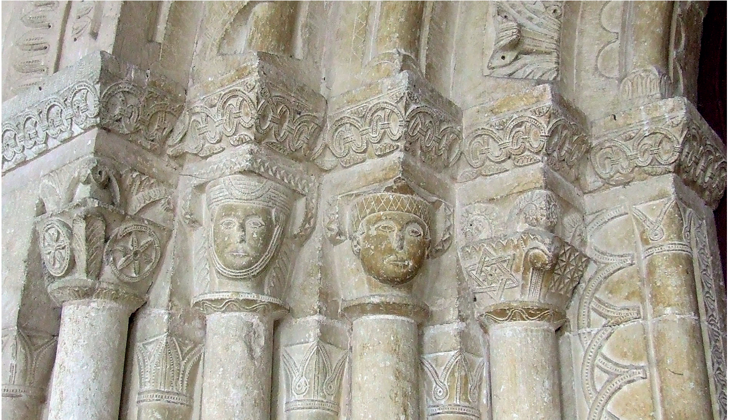
Portadako kapitetak / Capiteles de la portada

dituen piramide-enbor formako kapitela bat dago: aurrealdeko ertzean, erdian nerbioak eta perla-sortak dituen hosto batekin bola bat estaltzen du; goiko erpinean, barruan ikoroskiak dituen sare geometriko bat erakusten du eskuineko aurpegiak, eta ezkerrekoan, gurutzaturiko bi triangelu osatutako sei puntako izar bat dago, eta horren barruan, sei petaloko erroseta bat, dena perlatua eta trepano-ebaki batekin erdian. Izarraren gainean, lantza-formako hosto txikien ilara bertikal bat dago. Kapitela osoa errematatzen, goragoko sail batean, hosto txikiz osaturiko kaulikulu antzeko batzuek boluta sendoak osatzen dituzte erpinetan.