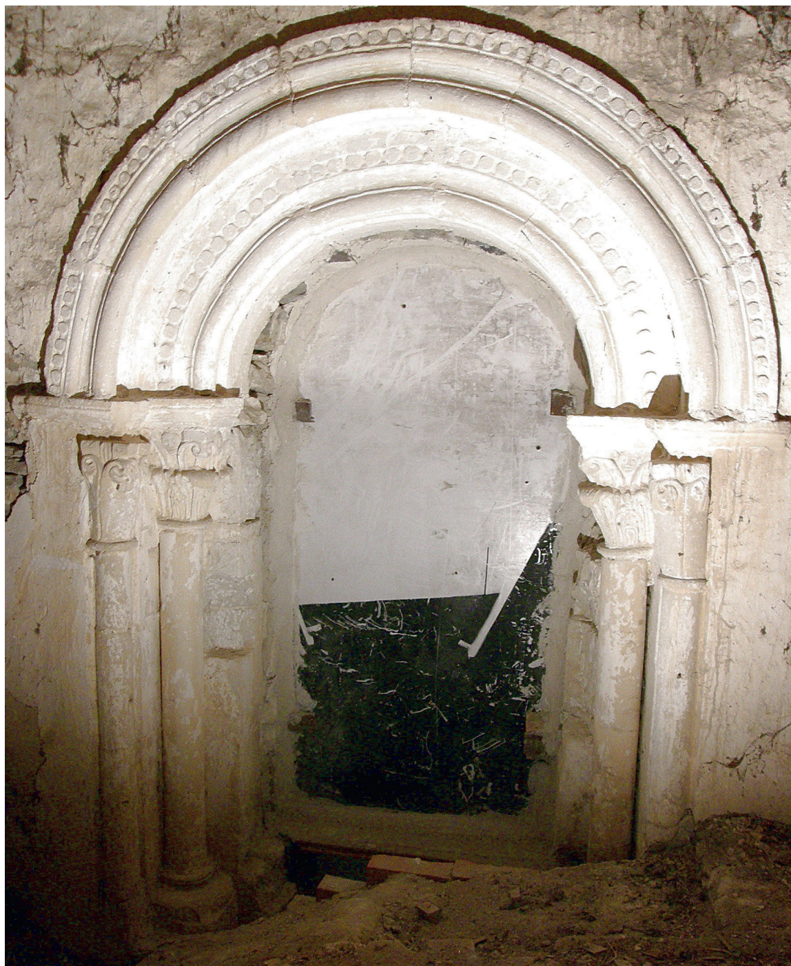
Hegoaldeko hormako leihoa, sakristiako estalkitik ikusita

Ventana del muro sur vista desde la entrecubierta de la sacristía