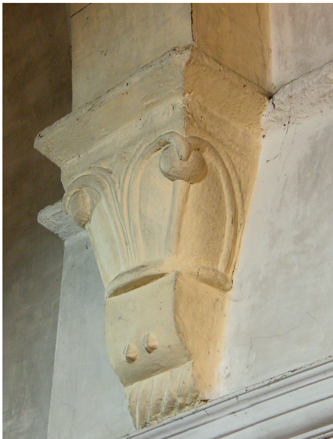
Garaipen-arkuko kapitelak / Capiteles del arco triunfal