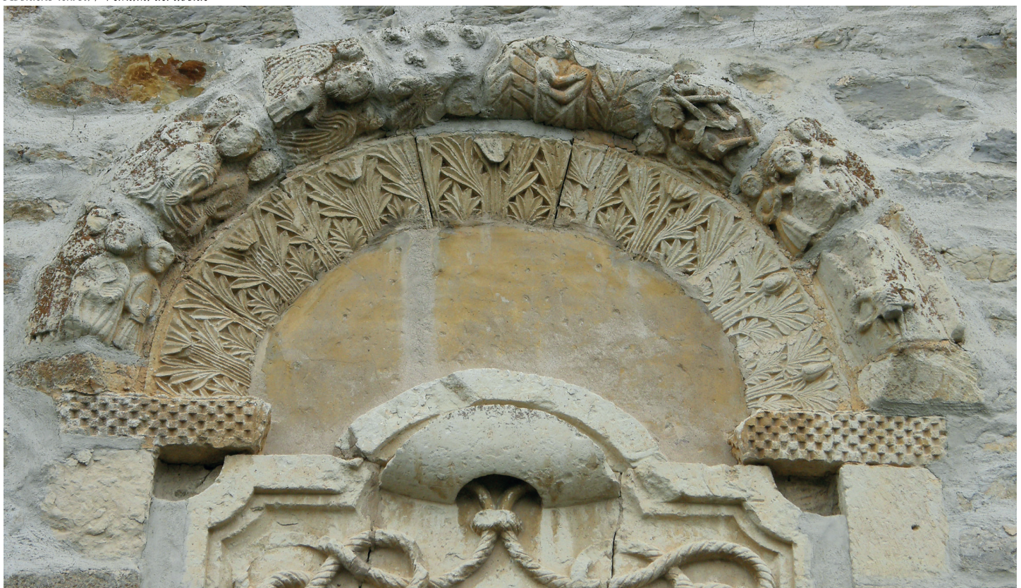
Absideko leihoa / Ventana del ábside