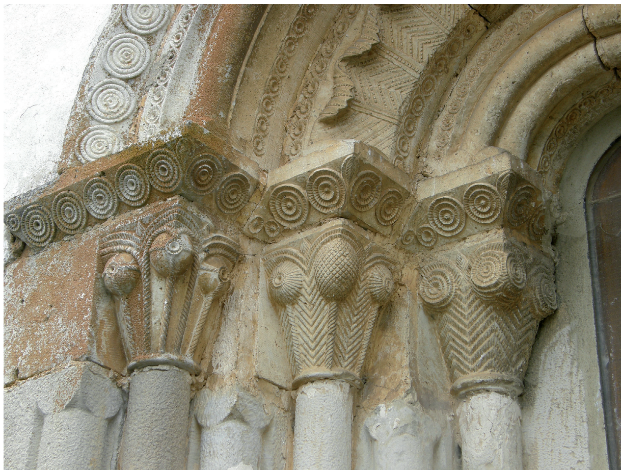
Ekialdeko hormaren beheko leihoa