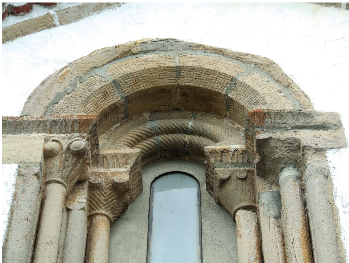
Ekialdeko hormako goiko leihoa