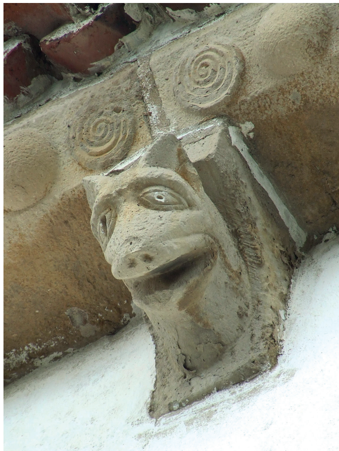
Harburua / Canecillo

Fuste monolitiko lisoa atzapar nabarmenduak dituzten harroinetan bermaturik dituzten sei zutabek –hiru, alde bakoitzean– eta horien zutabeartek eusten dioten multzoari. Apaindura zehatz eta landua kapiteletan metatzen