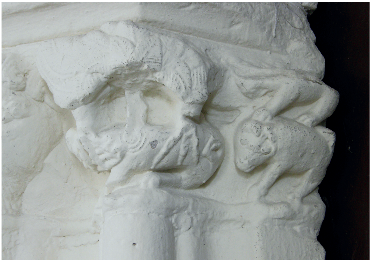
Portada. Arranoa barraþakinarekin eta lauoinekoak