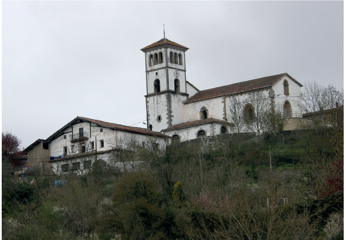
Herriaren ikuspegi orokorra