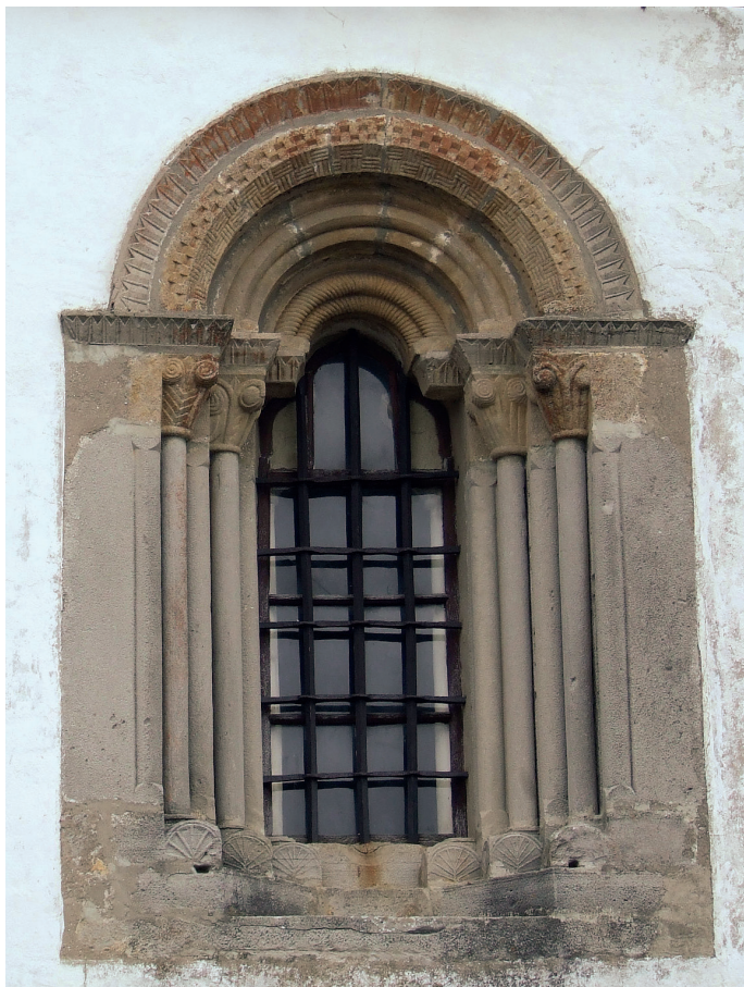
Presbiterioaren hegoaldeko leihoa / Ventana sur del presbiterio

ne bertikalak –tximisten modukoak– erakusten dituen zerrenda batek apaintzen ditu arkubarnera eta arkugainera. Apainduraren zehaztasun hori bigarren arkiboltan ere ageri da: puntak kanporantz iraulirik eta erdiko nerbio nakarkara –ardatz modukoa– dituzten akanto-hosto estilizatuuekin dago apaindurik; erdiko nerbio horretatik, bi aldeetarantz aldentzen diren hostoxka simetrikoak abiatzen dira, beraietan zurtoinen erliebe nakarkara –puntuen bueltan ere ageri dena– nabarmentzen delarik. Hirugarren arkibolta itxuratzen duen baketioia ere arkubarnerako eta arkugainerako zirkulu zentrokideen zerrendek markoztatzen dute. Deskarga-arkua zirkulu zentrokideak eratzen dituzten zurtoin finezko zerrenda batek apaintzen du. Eskema berori errepikatzen da arkuari eusten dion inposta-lerroan ere, non, arkiboltan arkubarneran eta arkugaineran bezala, tximisten moduko ebakigune erradialak dituzten hiru zirkulu zentrokide ageri diren.