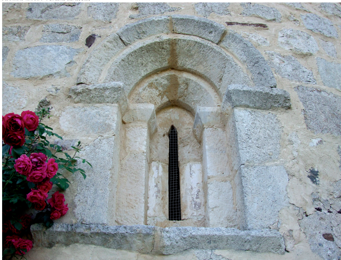
Absideko leihoa / Ventana del ábside