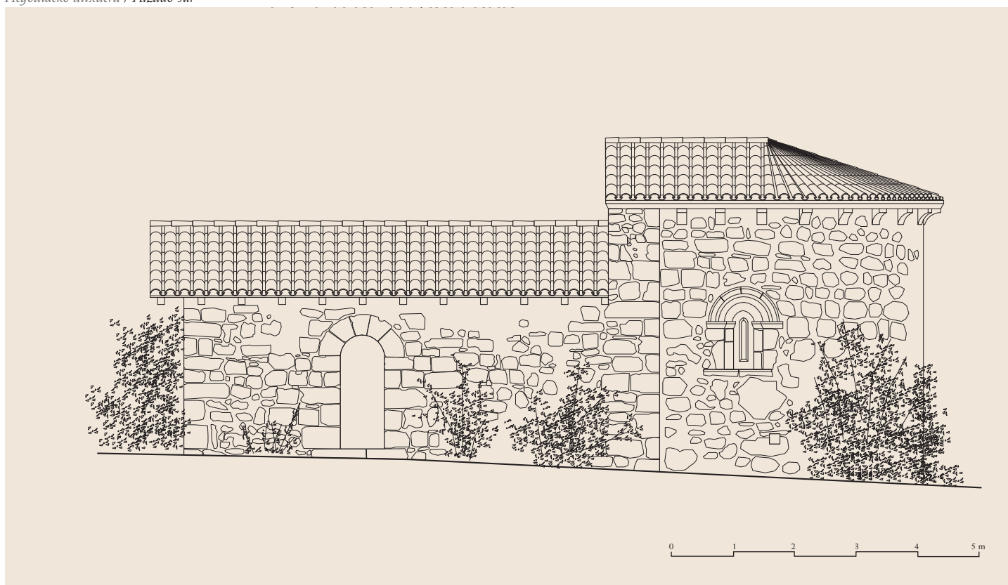
Hegoaldeko altxaera / Alzado sur