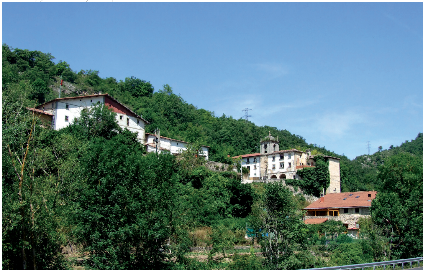
Herriaren ikuspegi orokorra / Vista general del pueblo

En la Edad Media existían dos pueblos con el nombre de Atauri, Ataburi de Suso y Ataburi de Iuso ,