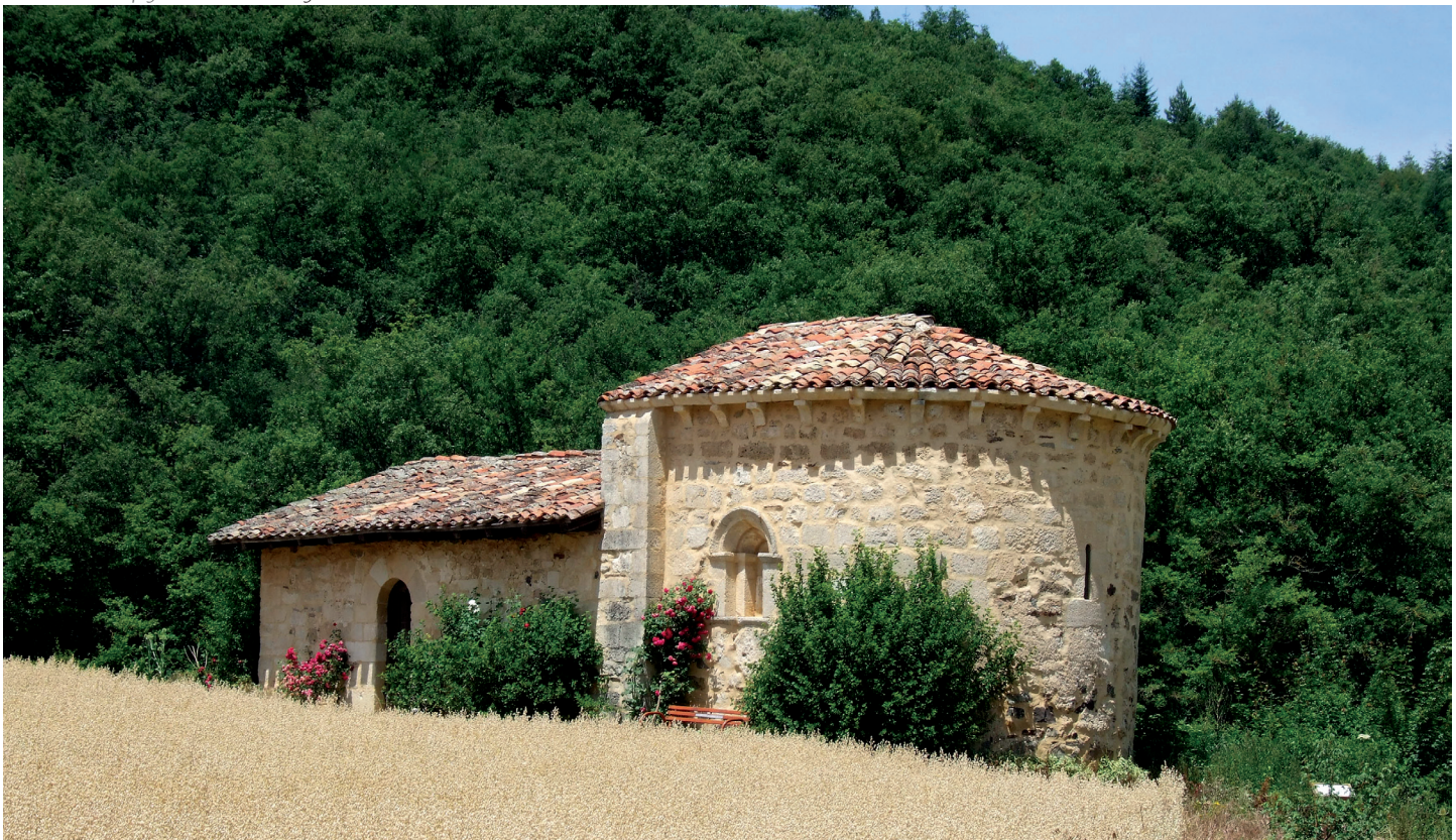
Baselizaren ikuspegi orokorra / Vista general de la ermita

La ermita de la Soledad es un edificio que conserva íntegra su cabecera semicircular románica, mientras que el cuerpo de la construcción data de época posterior. Esta cabecera, levantada con buen sillar, se cubre con bóveda de horno y se apoya en el arco triunfal, realizado en sillar con grueso muro, que descansa, a la izquierda, sobre una imposta con moldura ajedrezada, decorada con sogueado en el lado derecho. En ese mismo lado, un hueco entre