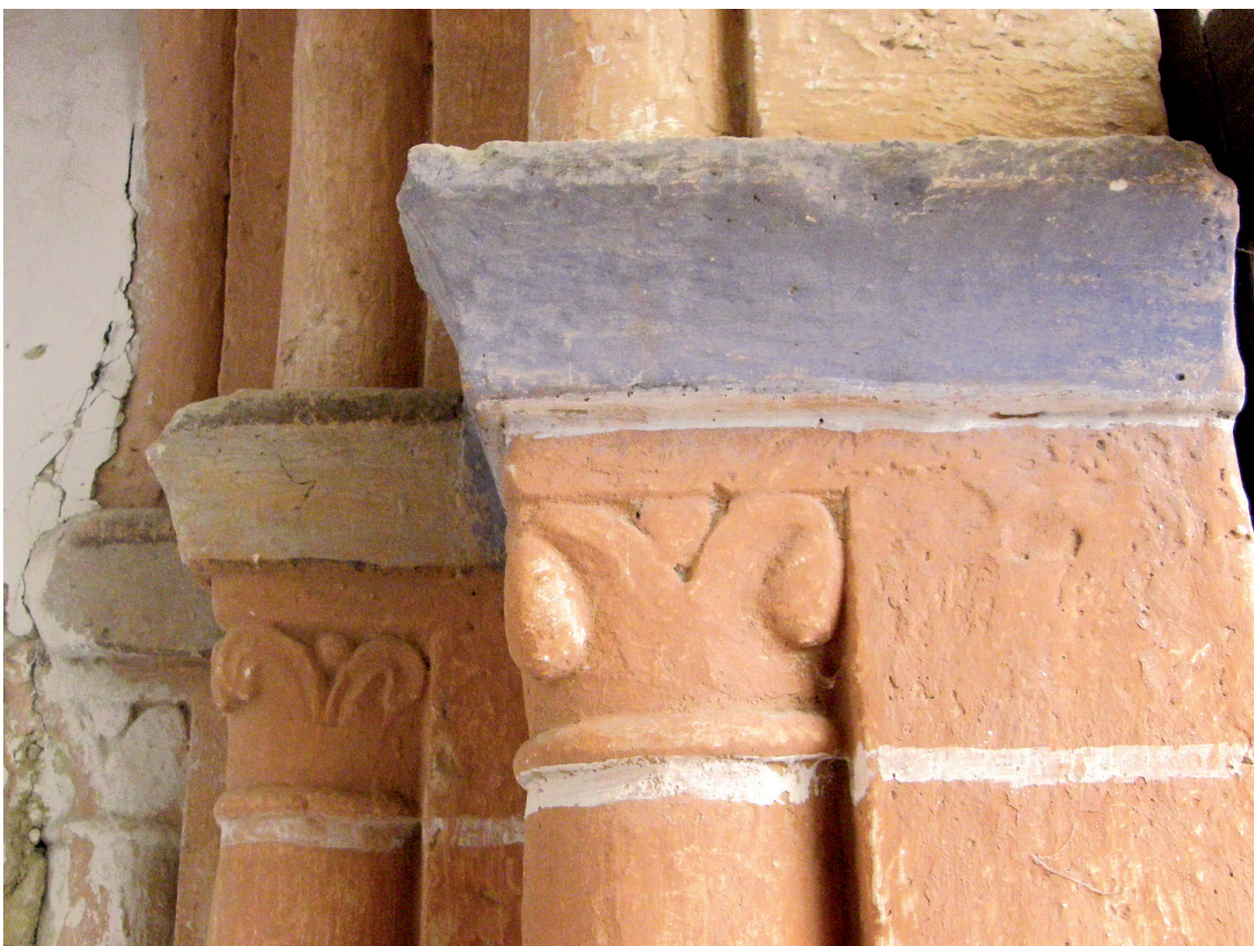
Bataiatagia. Portada zabarraren kapitelak