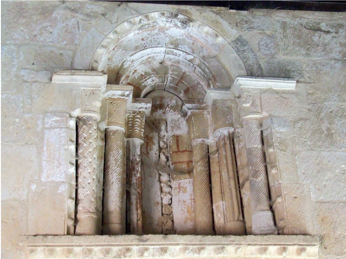
Hegoaldeko hormako leihoa