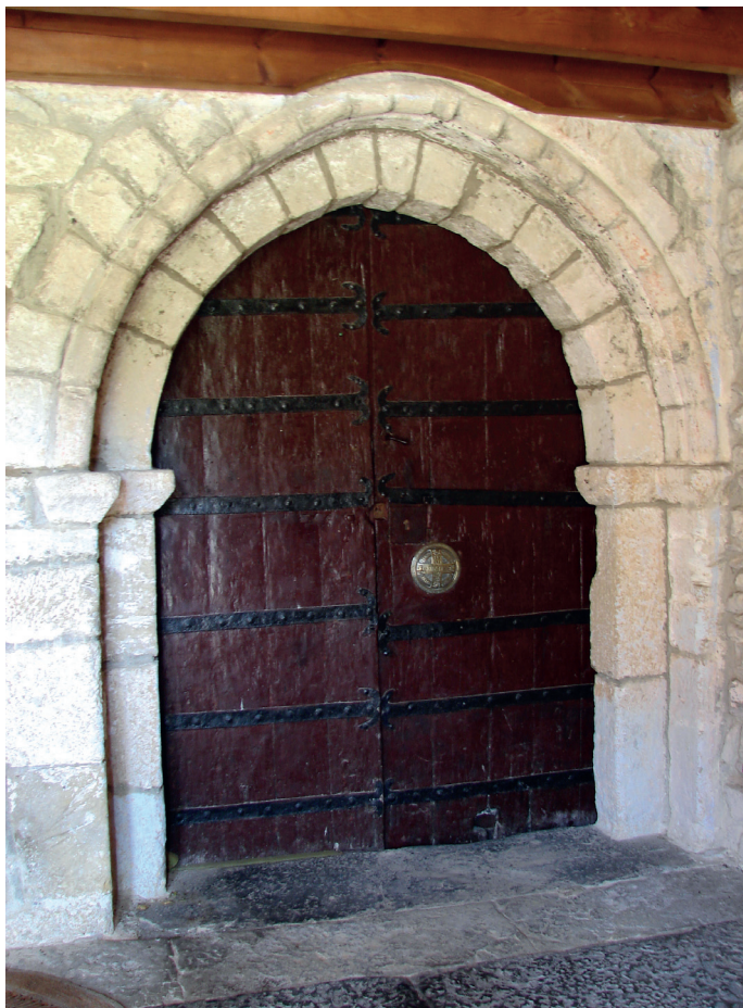
Portada / Portada

zurtoin batek inguratzen ditu behealdean, gero goraka doa saskiaren goiko angeluetaraino, eta han bola handi batzuk ageri dira dingilizka.