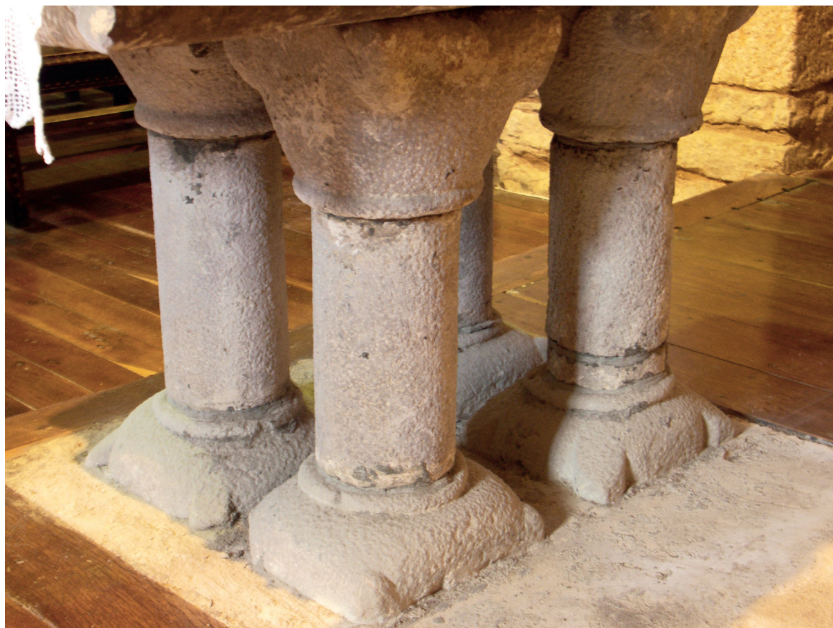
Aldareko mabaiaren euskarria