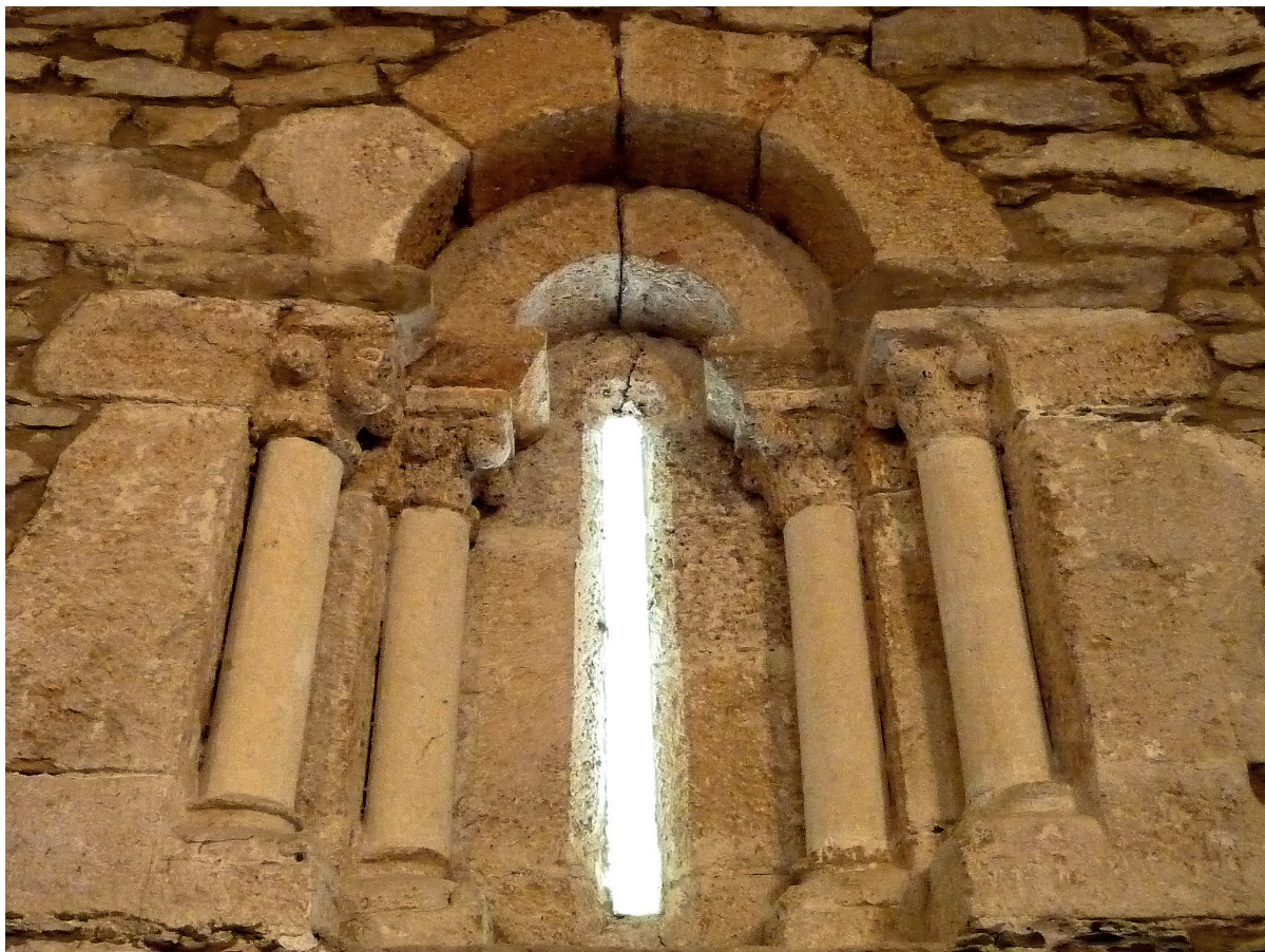
Burualdeko leiboa barrualdetik