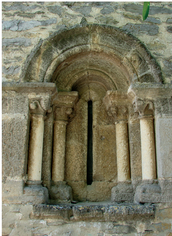
Burualdeko leihoa / Ventana de la cabecera

Elizatea apaizetxearen azpian dago, eta Erdi Aroko portada sinplea hartzen, bi arkiboltako arku zorrotzekoa. Lehenengo arkibolta dobelatua da, eta ertz bizia du. Bigarrenak baketoi lodia du profilean. Arku honen zurkaitzek ere ez dute apaingarririk, ez inposta alakatuan, ezta ertz itxuraz ebakitako zangoetan ere. Ateak antzinako burdineria du oraindik.