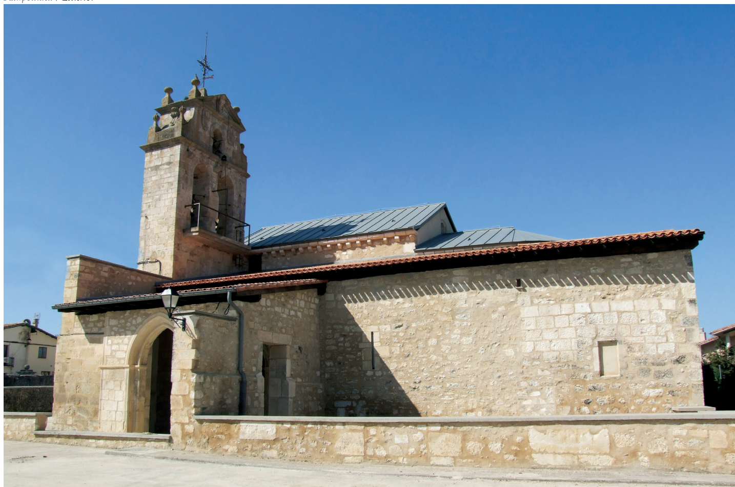
Kanpoaldea / Exterior

En el exterior de la construcción, bajo un pórtico rectangular, aparece la portada principal, originariamente de cinco arquivoltas apuntadas y sobreacto, que en la actualidad se ve reducida a tres arquivoltas, completas las interiores, y los arranques de las demás, que se vieron destruidas al eliminar la construcción existente sobre el pórtico. Son arquivoltas apuntadas, y, en orden de dentro afuera, la pri-