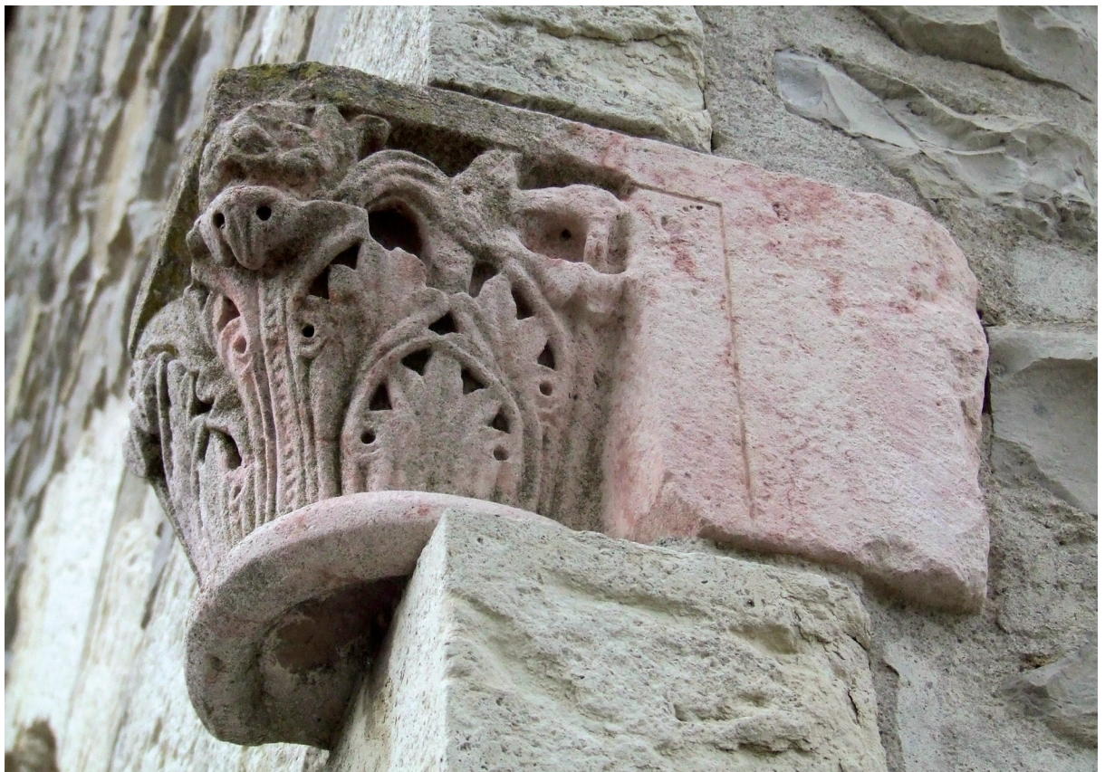
Hegoaldeko bormako kapitela Capitel del muro sur