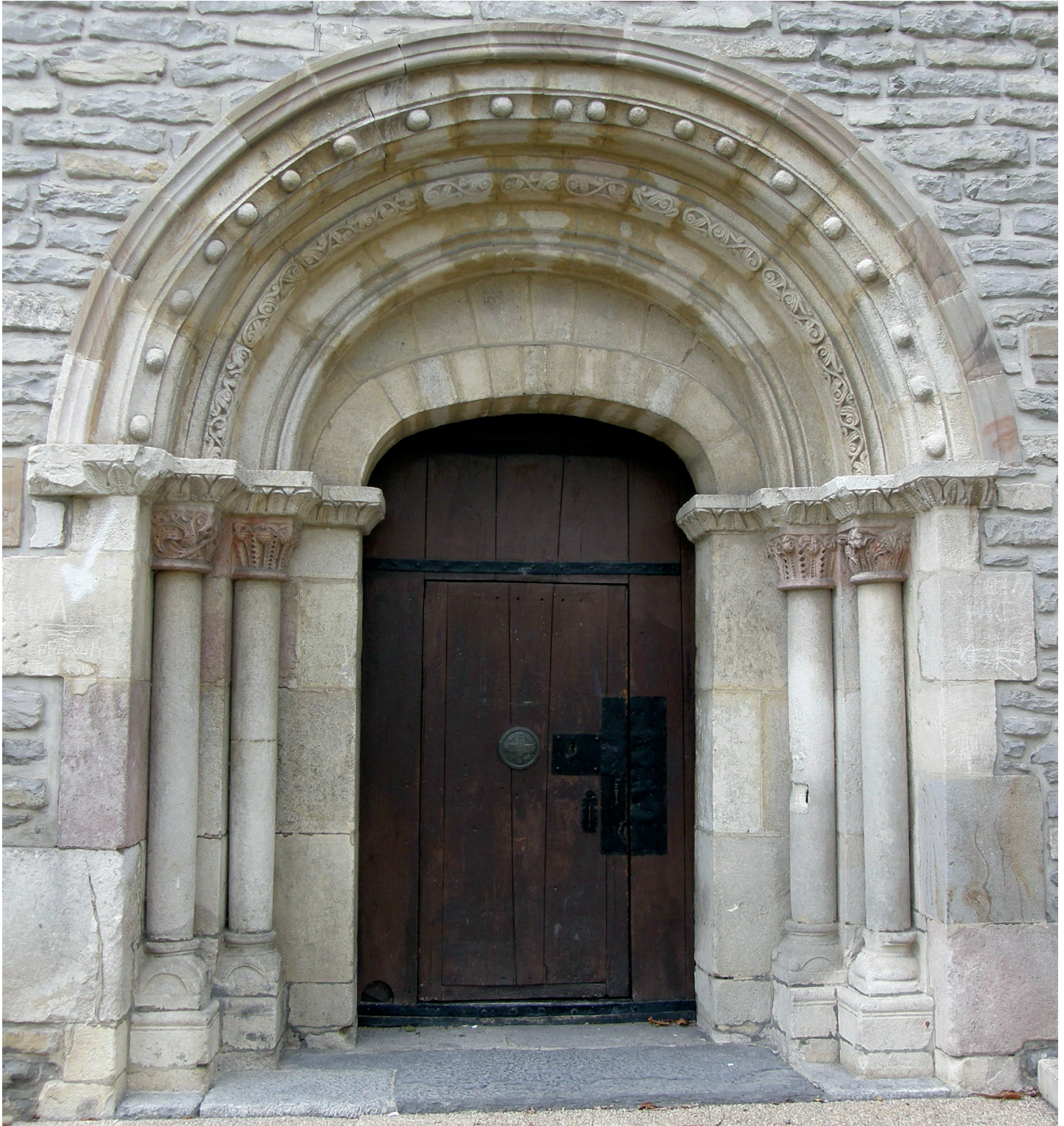
Portada / Portada

se aprecian algunos matices: una lleva una fina moldura; otra, es más redonda, aunque conserva las bolas en los ángulos; y las otras dos son iguales. Están separadas del suelo por un zócalo rematado con moldura.