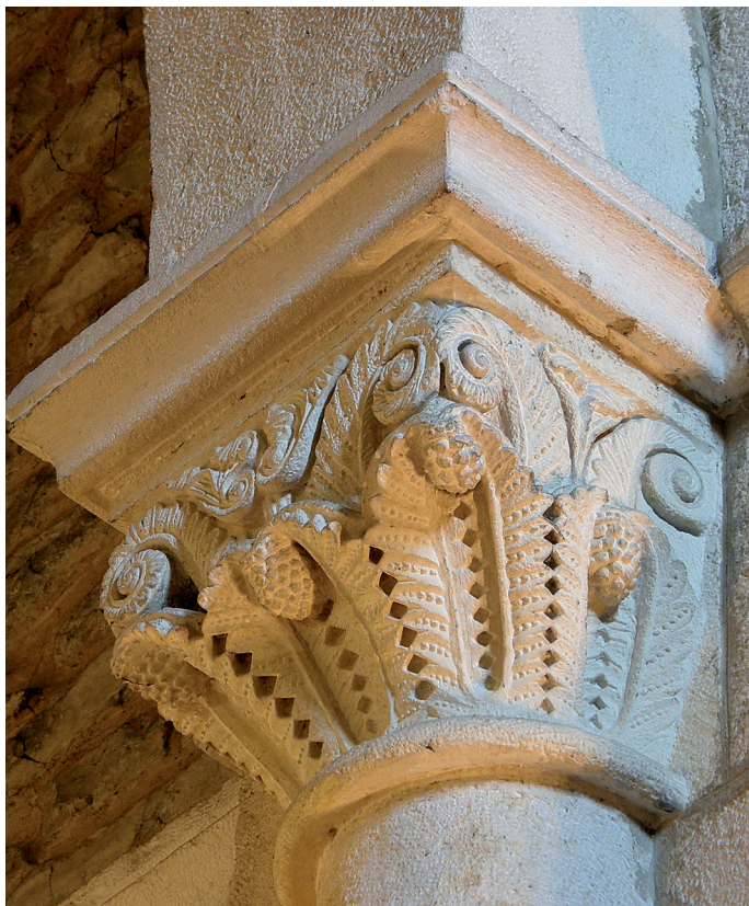
Garaiñen-arkuko kapitela / Capiteles del arco triunfal