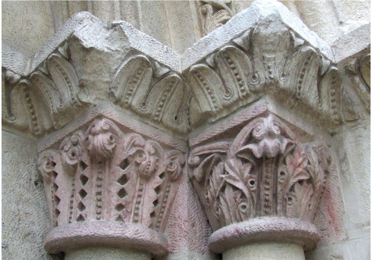
Portadako kapitela Capiteles de la portada