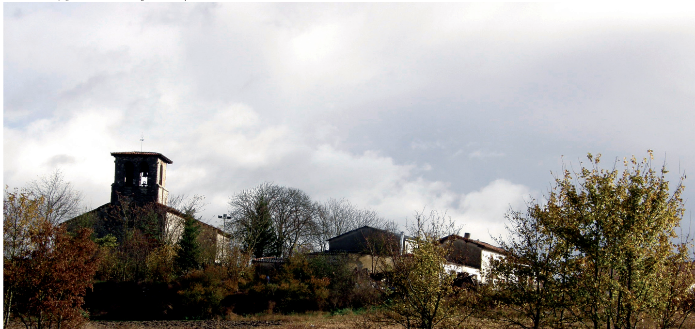
Herriaren ikuspegi orokorra / Vista general del pueblo

No siempre ha sido así. Como es habitual en la zona, ya aparece en el documento de la Reja de San Millán, dentro del Alfoz de Divina, compartiendo la entrega de una reja con lurre y Lopidana. Entonces se le denominaba Avoggoco . Abetxuko ha