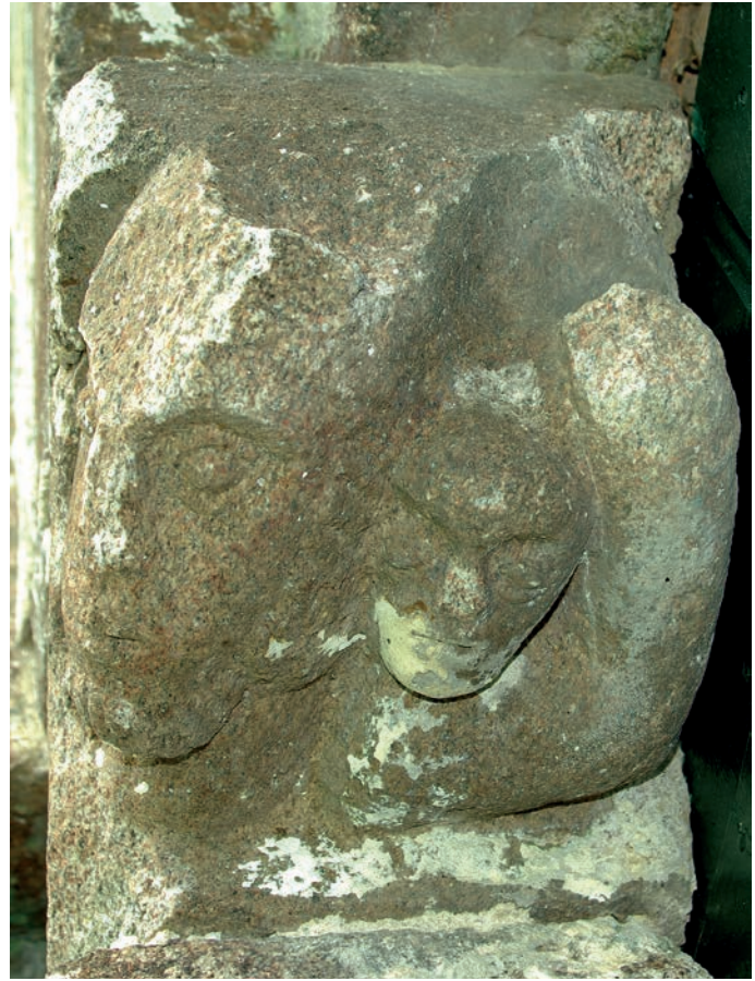
Mocheta de la portada oeste