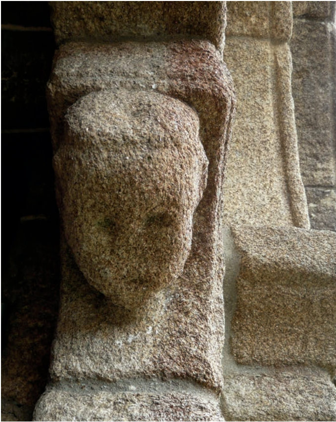
Mocheta de la portada oeste

García Iglesias las analiza en su tesis doctoral y en su obra sobre las pinturas murales de Galicia. Están a la espera de ser restauradas.