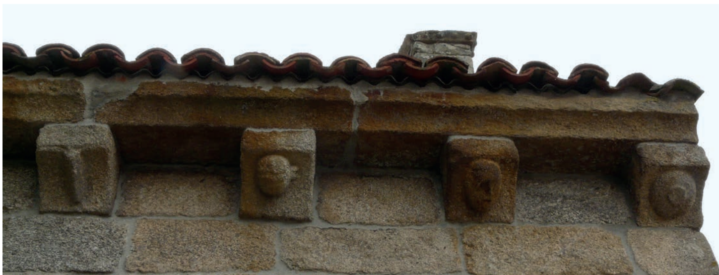
Canecillos del alero norte

ornamental puede vincularse con la presente en Santa María de Ventosa (Agolada).