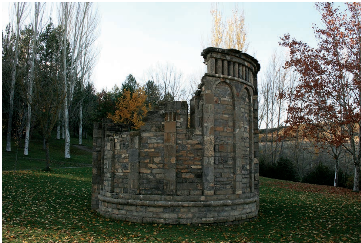
Ábside de Santa María de Gavín