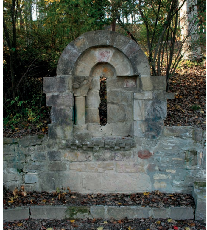
Ventana absidal de San Martín de Castiello de Guarga