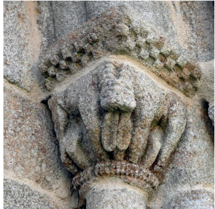
Capitel de la portada occidental

Pelagio de Taboada dos Freires y, en última instancia, con el tímpano de San Xoán de Palmou (Pontevedra), que parece ser el modelo de toda esta serie de representaciones.