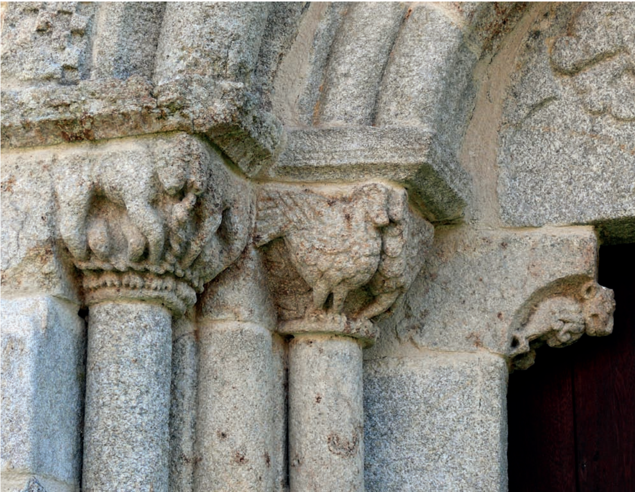
Capiteles de la portada occidental