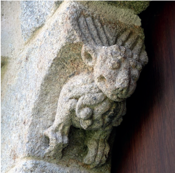
Mocheta de la portada occidental