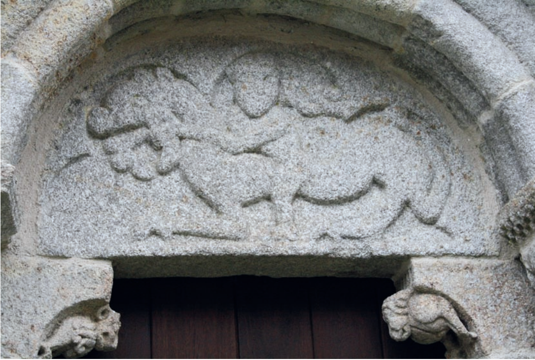
Tímpano de la portada occidental