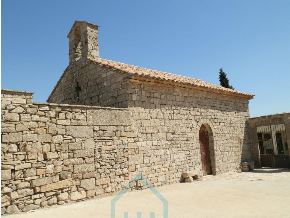
Fachada oeste y muro sur