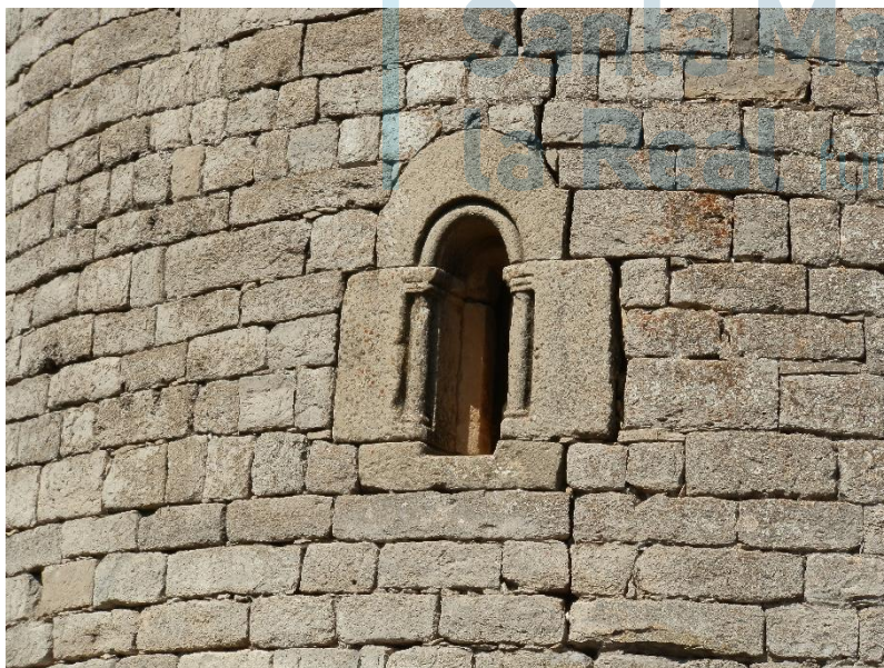
Ventana del ábside

Exteriormente, el paramento absidal es liso, y en su centro se abre una curiosa ventana con arco de medio punto monolítico, en cuya esquina se representa una arquivolta con moldura de baquetón. En las esquinas de las dos jambas, también monolíticas, se tallaron sendas columnillas con sus respectivos capiteles, fustes y basas. Bajo la cornisa recorre una moldura formada por alargadas piezas prismáticas en las que se rebajó la parte central, las cuales se apoyan en unos canecillos decorados con motivos geométricos, entre los que se aprecian algunos cilindros y bolas. Bajo los canecillos, discurre una serie de orificios cuadrados alineados horizontalmente, que por su número y escasa separación entre ellos, no cabe pensar que sean mechinales. La puerta de