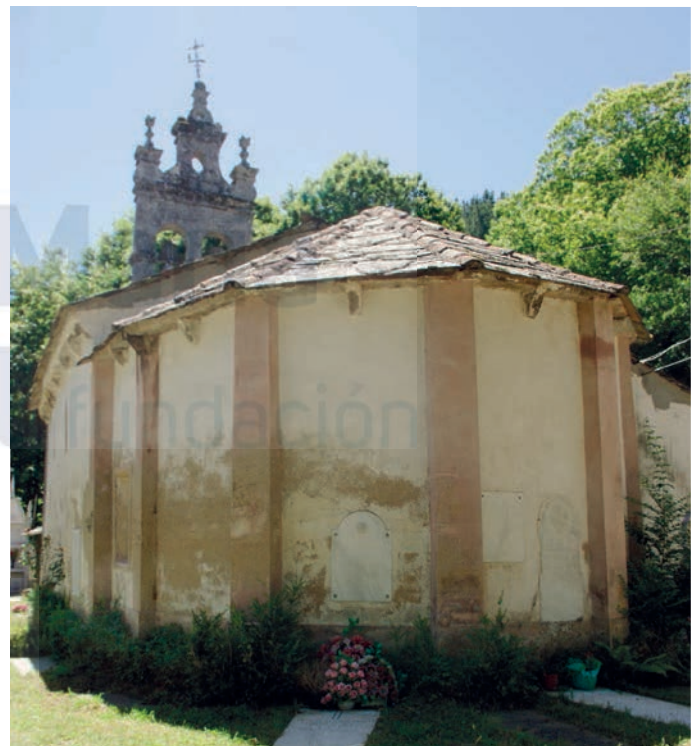
Vista desde el ábside

ración de líneas oblicuas, sobre un pie prismático, añadido con posterioridad. En segundo lugar, la pila de agua bendita, en el norte, es una gran copa con decoración de baquetas y de gallones rehundidos sobre un pie cilíndrico con base moldurada.