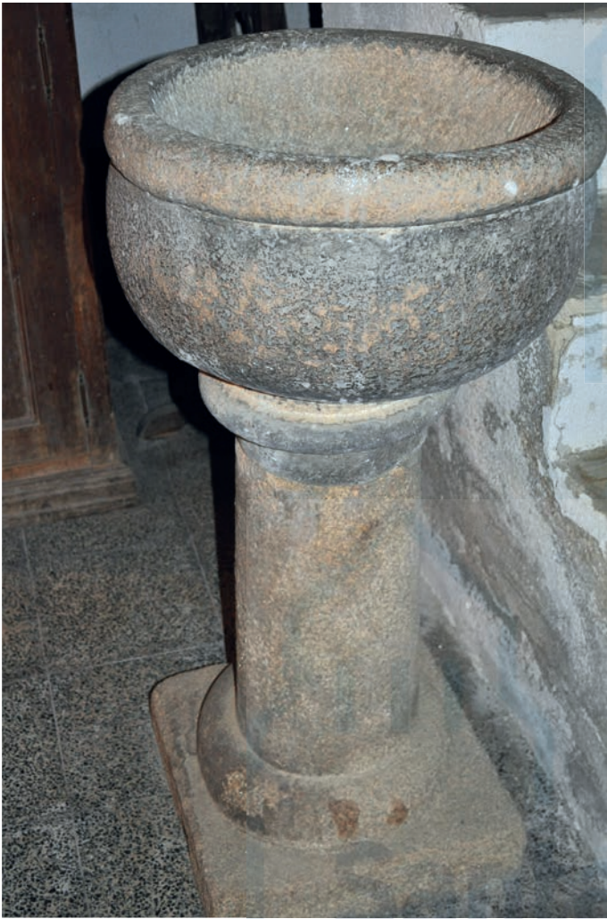
Pila de agua bendita

Se conserva en el interior un capitel de una pilastra, que demuestra que la fábrica original debió de haber sido mucho más rica de lo que las reformas posteriores nos revelan. Se trata del calathos formado por tres cintas de acantos y con un remate hoy muy deteriorado. Conviene señalar también la presencia de una pila de granito compuesta por un fuste liso y esbelto y un cuerpo semicircular carente de elementos decorativos a excepción del remate de la boca en un simple collarino.