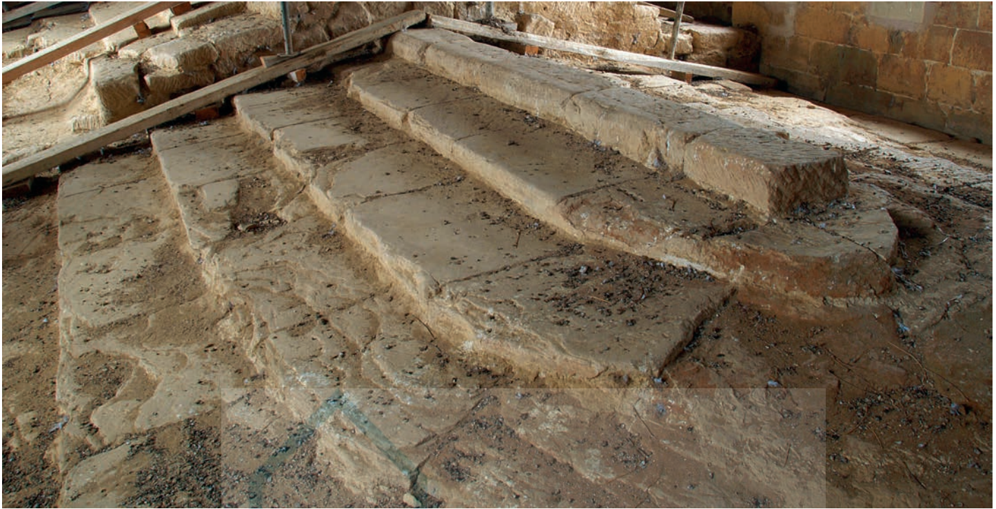
Restos de la primitiva cubierta pétrea

del templo que oculta la cubierta primitiva del mismo. Un entramado de puntales afianza la cubierta "nueva" haciéndola descargar sobre la primitiva con el riesgo que ello comporta para su estabilidad. La cubierta de la cabecera tiene un tratamiento específico. Su hechura es perfecta, no en vano es la zona del templo de mayor trascendencia y a la que se dedica también en lo arquitectónico más atención. Curiosamente este templo ha pasado desapercibido para la mayor parte de las