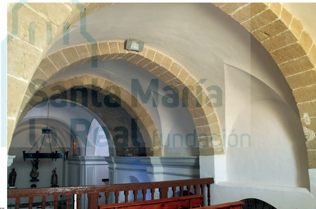
Bóveda de la nave

NAVAL MAS, A. y NAVAL MAS, J., 1980, II, pp. 53-56; RÍO MARTÍNEZ, B. d'o, 2005, pp. 58-60.