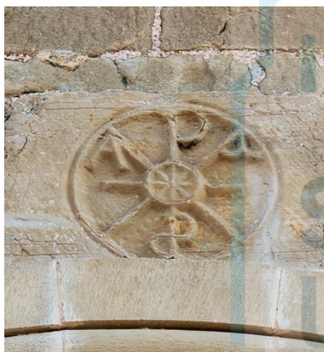
Crismón reutilizado sobre la portada