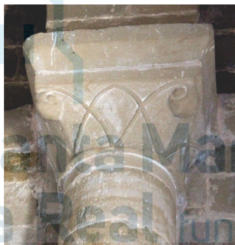
Capiteles del interior