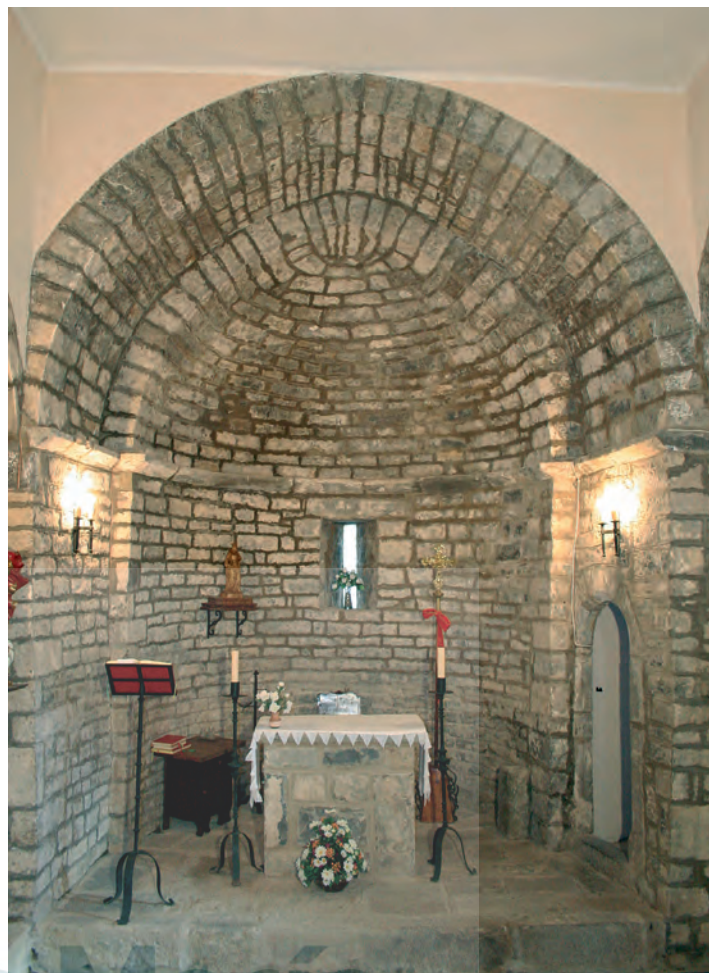
Interior del ábside

La bibliografía data en torno a mediados del siglo XII la construcción románica original, si bien se hace necesario indicar que la posterior reforma moderna del XVII alteró profundamente el conjunto, especialmente en la zona meridional con el añadido de la nave ya citada. Queda ésta separada de la original por medio de una doble arcada de medio punto que apoya en una columna con basa cuadrada, cuya fábrica no permite establecer una cronología precisa. De época moderna, pues, son la nave de la epístola y la torre. Por tanto, el volumen general del conjunto quedó completamente modificado respecto al del templo medieval, desvirtuando el ideario románico.