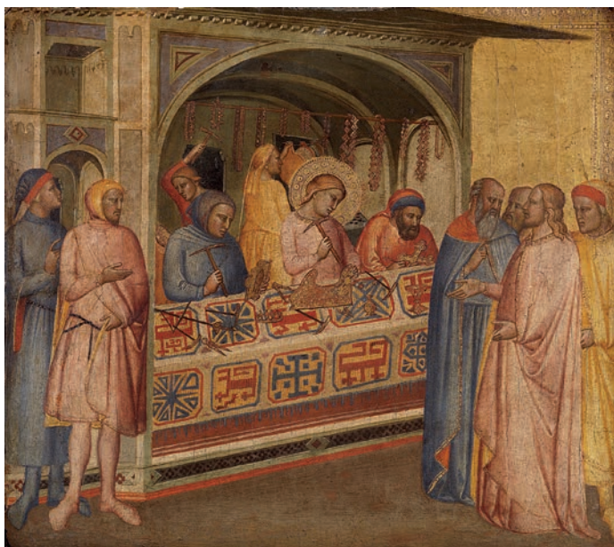
Fig. 1. Maestro de la Madonna della Misericordia, San Eloy ante el rey Clotario, Museo del Prado ( www.museodelprado.es )

En algunas representaciones pictóricas donde se muestran talleres de orfebres aparecen algunas de las herramientas utilizadas para realizar sus diseños, como el compás, uno de los emblemas de los arquitectos. Esto es visible en la pintura de San Eloy en el taller de orfebrería (c. 1370) del Maestro de la Madonna de la Misericordia, conservado en el Museo del Prado (nº inv. P02841) (Fig. 1), o San Eloy en su taller (1515) del pintor suizo Niklaus Manuel, conservado en el Kunstmuseum de Berna (nº inv. 2020b). En el inventario de bienes del citado orfebre Jaume Anglés también figuran dos compases 18 . De hecho, el escudo del gremio