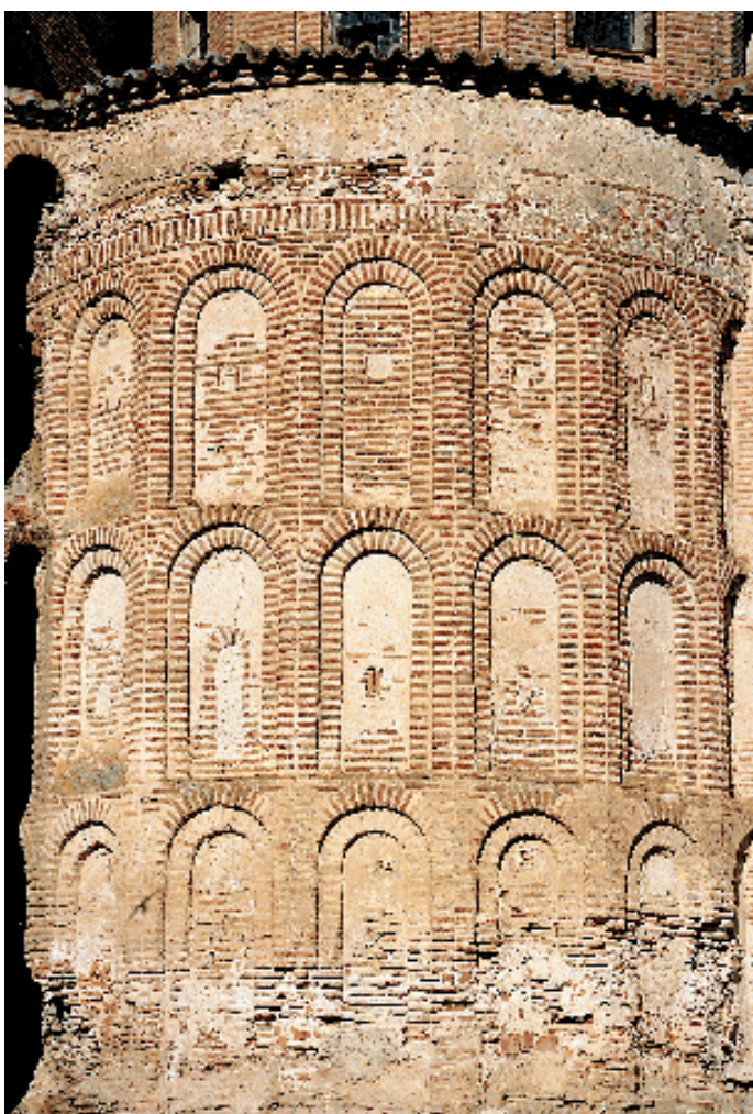
Arquerías del ábside

similares a los de Narros del Castillo o Fontiveros, que apoyaban en pilares de sección rectangular. Todo el cuerpo de naves debe corresponder al primer momento constructivo, pero ha sido radicalmente reformado en actuaciones posteriores que dotaron al templo de piezas artísticas de gran valor, entre las que destaca el retablo de la capilla del Marquesito, fundada hacia 1500 por el citado obispo Alonso Suárez. Arquitectónicamente destaca la reforma barroca de 1766, obra de Segundo Cecilia y su hijo, que cubre la nave central con yeserías barrocas que ocultan la armadura. Ésta, permanece aún sobre las yeserías y según Fernández-Shaw tiene dos zonas bien diferenciadas, una, con almizate con lazo de ocho y otra con pares y nudillo. La primera sería del siglo XV y la segunda del XVI. Presenta una torre levemente virada a los pies, obra del siglo XVI, que sigue los cánones de otros ejemplos mudéjares de la comarca. Construida en ladrillo, sólo se disponen vanos de medio punto en el cuerpo superior y se remata con un antepecho que recuerda a Donjimeno.